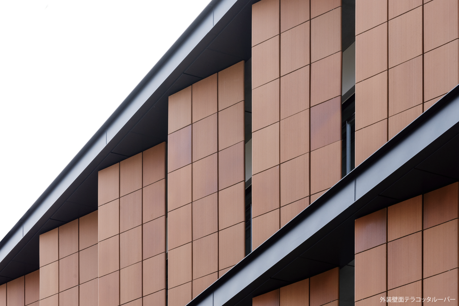
外装壁面テラコッタルーバー