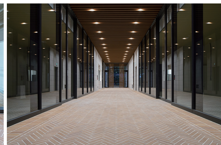
エントランス内観