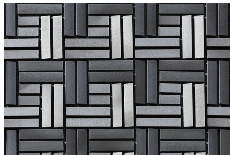
外装壁面タイルディテール