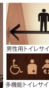
男性用トイレサイン