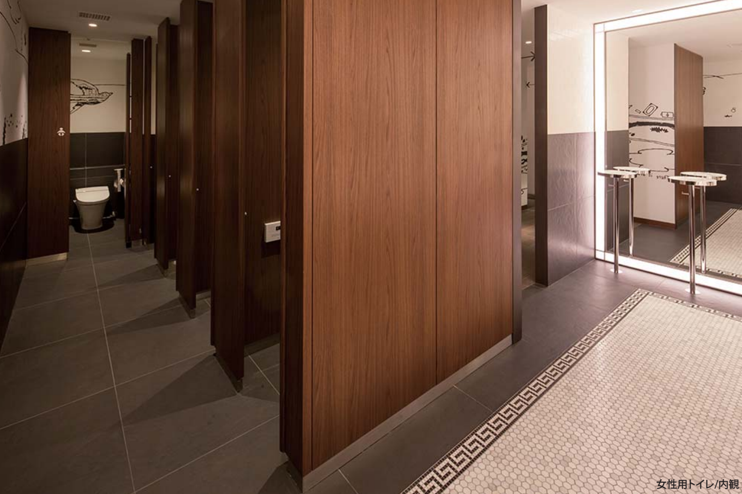
女性用トイレ/内観