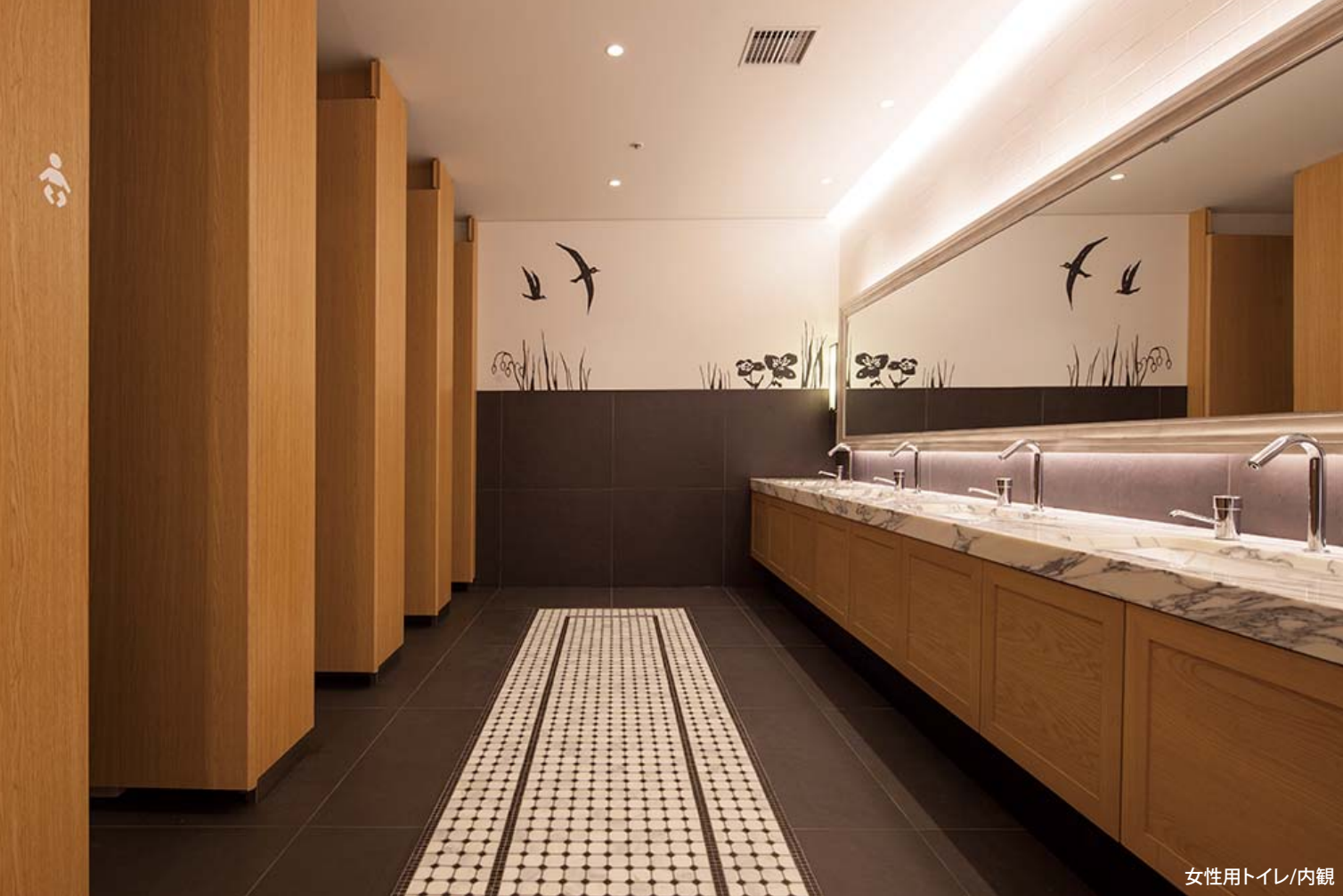
女性用トイレ/内観