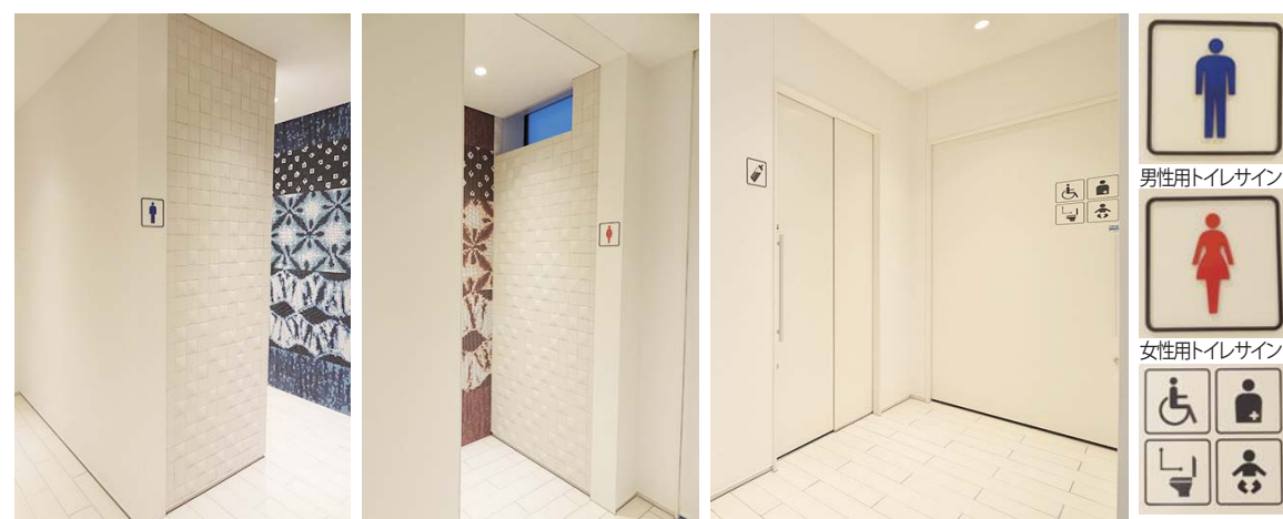
男性用トイレ入り口 女性用トイレ入り口 多機能トイレ・授乳室入り口 多機能トイレサイン

男性用・女性用トイレ入り口には、赤と青に色分けしたモザイクタイルで壁面一面を装飾を施した。視認性を高めるとともに、タイルを絵画のようなデザインに仕上げることで楽しさと期待感を演出している。