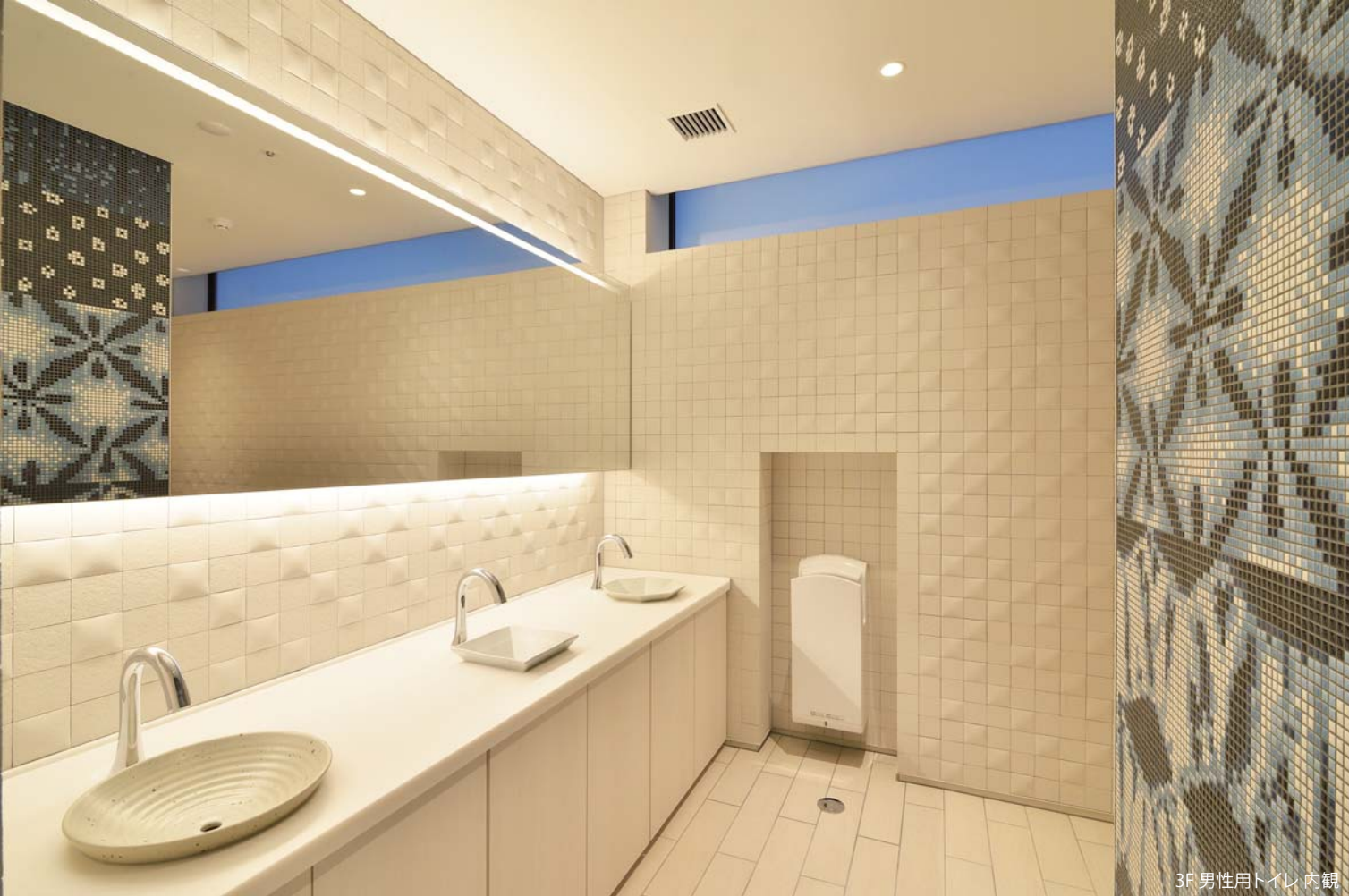
3F 男性用トイレ 内観