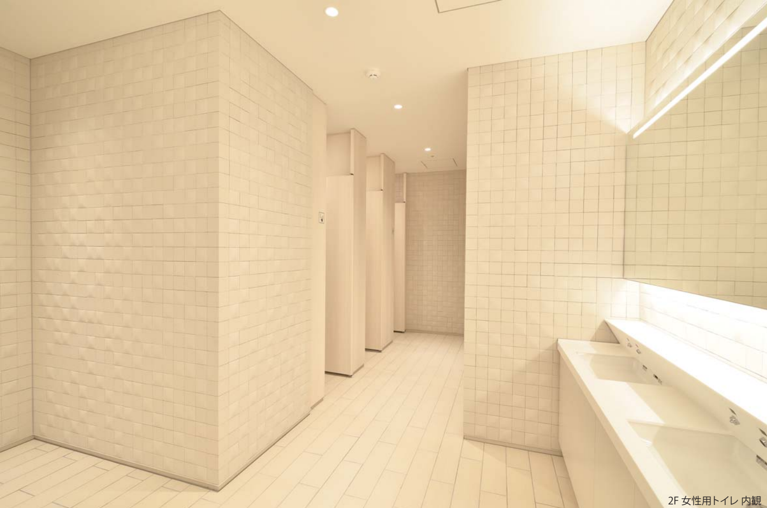
2F 女性用トイレ 内観