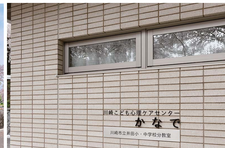
エントランス側面開口部