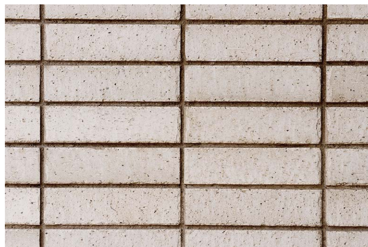
外装壁面タイルディテール