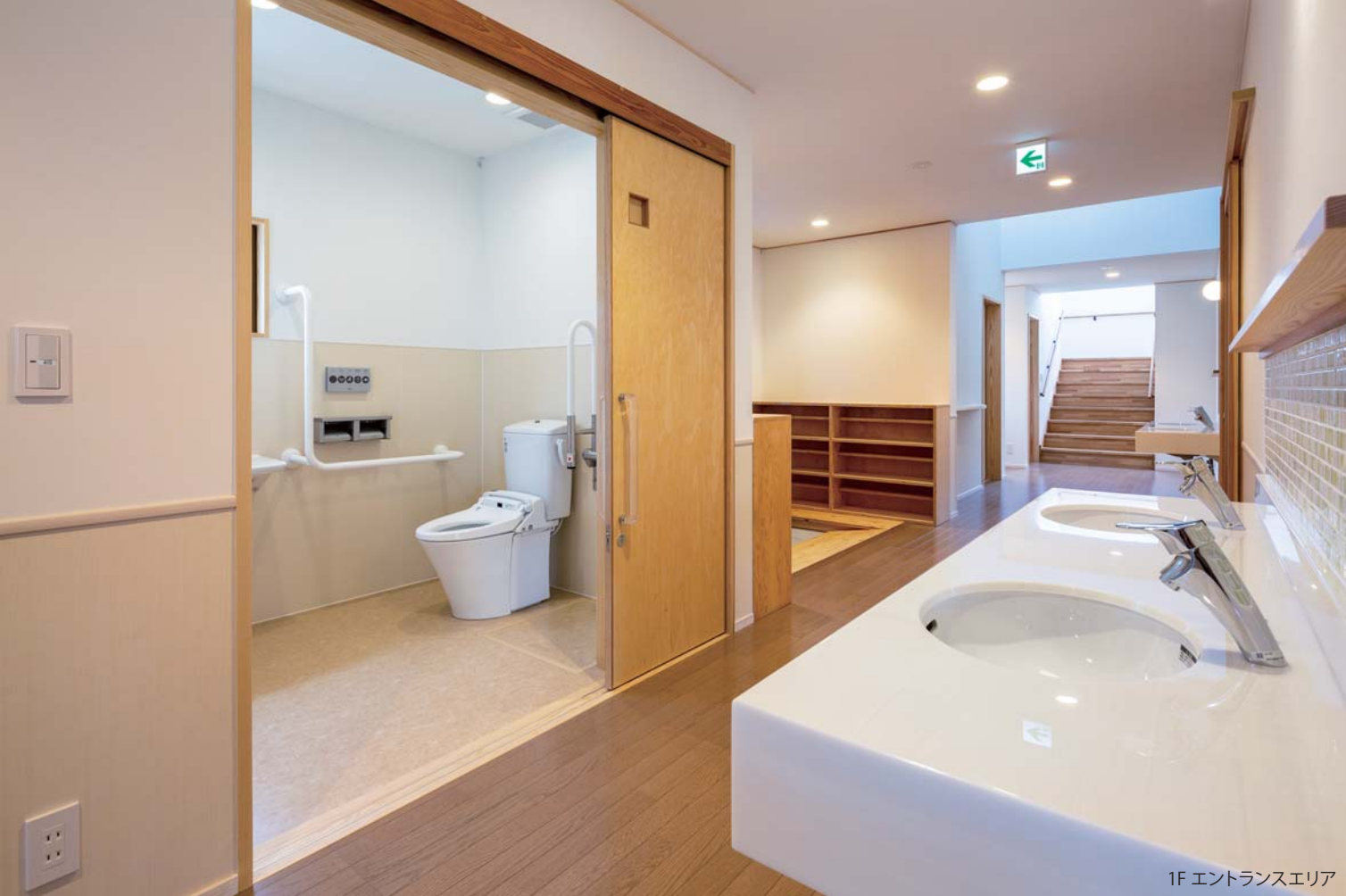
1F エントランスエリア