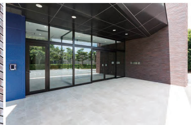
エントランス外装壁床面