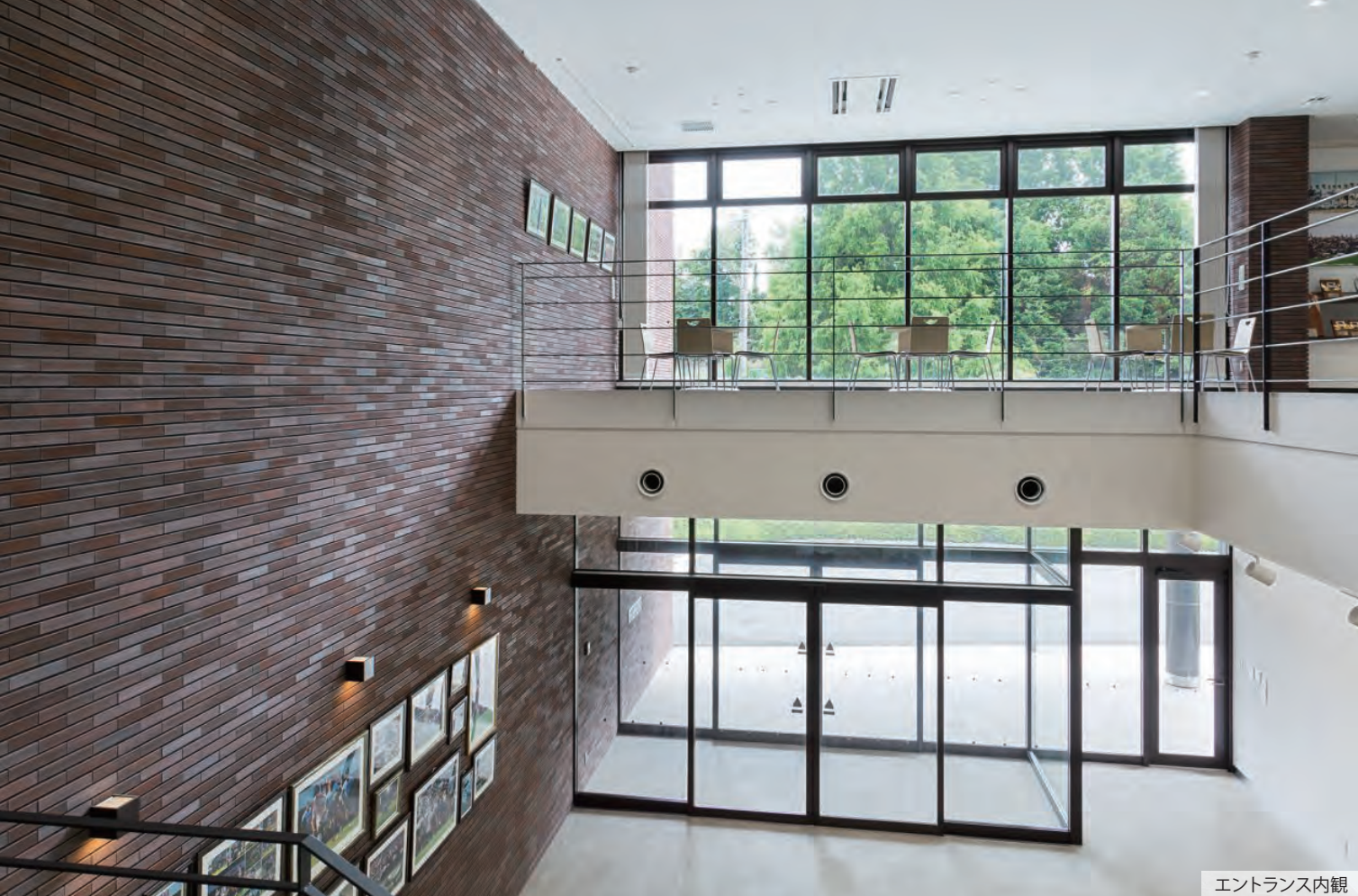
エントランス内観