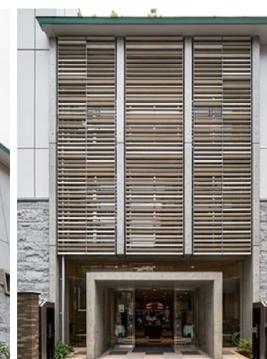
東側エントランス外装壁面