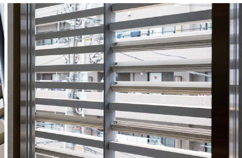
外装壁面タイルディテール(内部より)