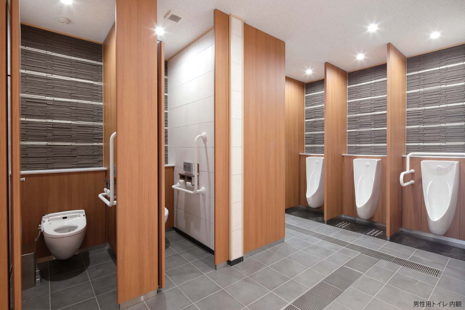
男性用トイレ 内観