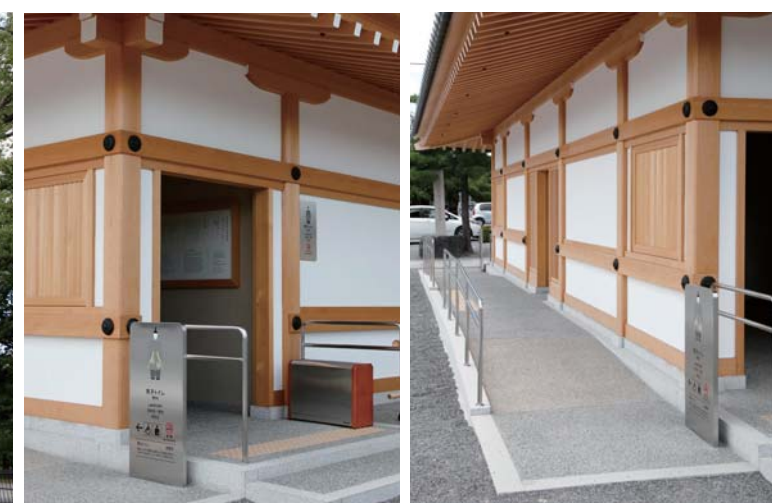
トイレ入り口まわり

男女トイレの両側から車椅子でアクセスできるゆるやかなスロープを備え、多機能トイレを中央に設けたバリアフリー仕様になっている。