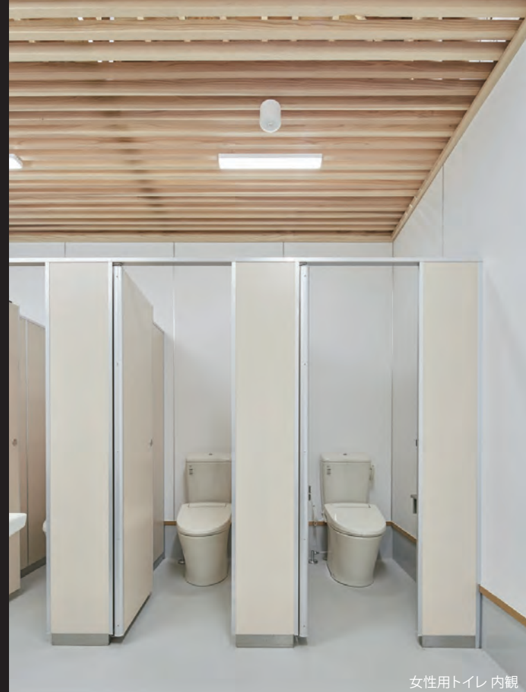
女性用トイレ 内観