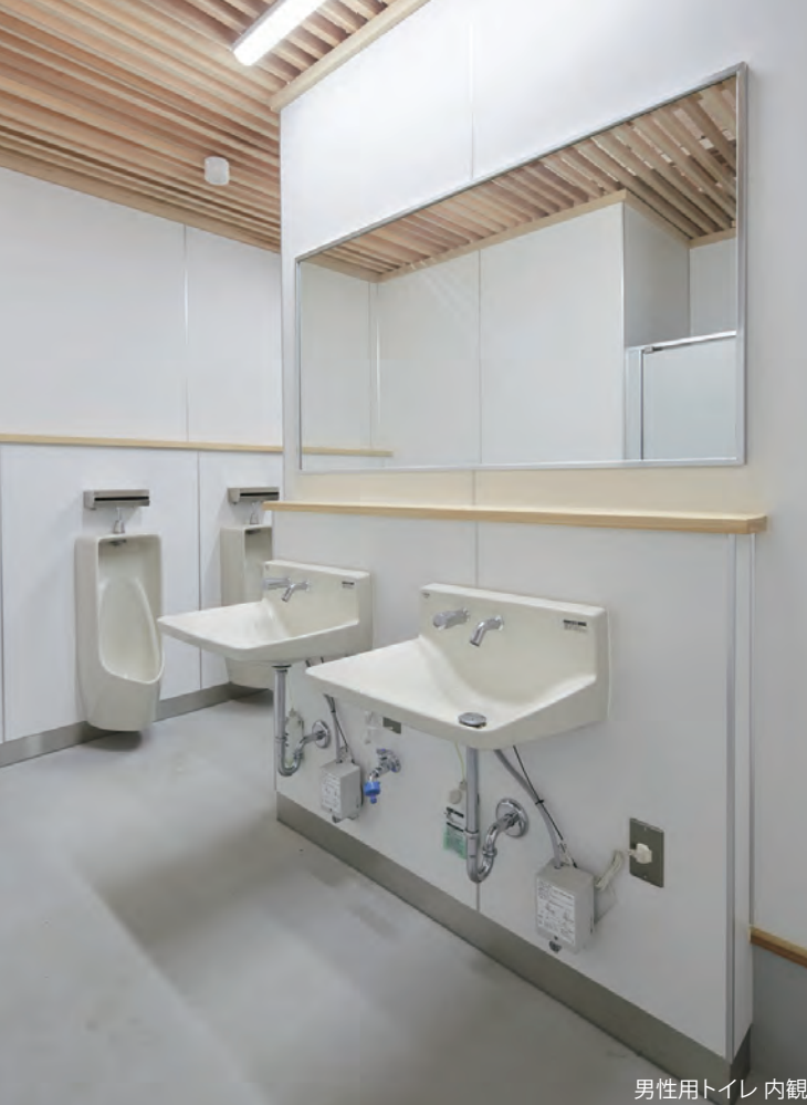
男性用トイレ 内観