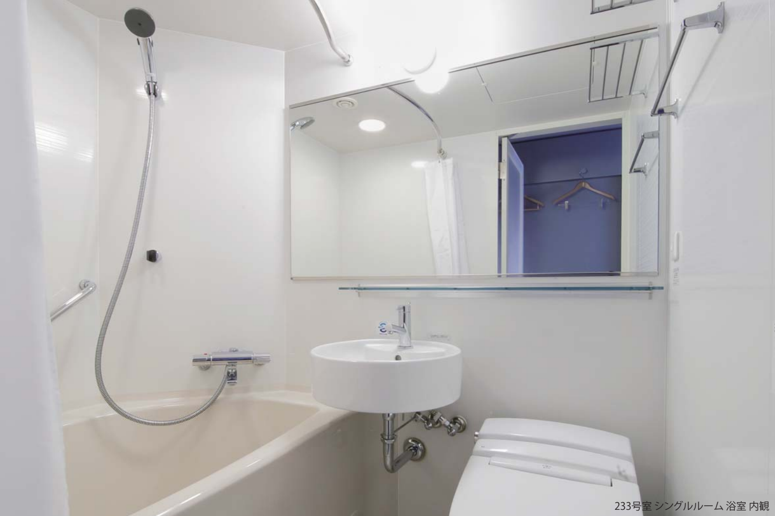
233号室 シングルルーム 浴室 内観