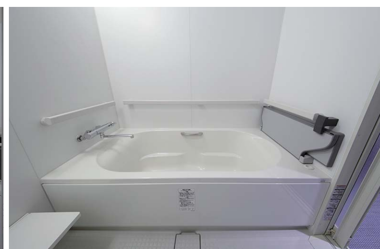
浴室 腰掛付保温フタ