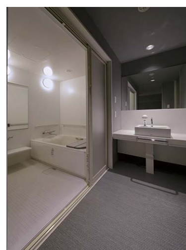
浴室入り口まわり