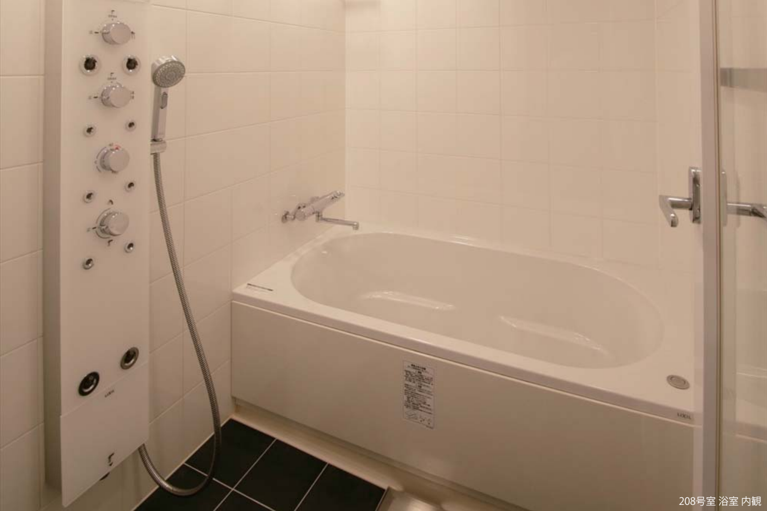
208号室 浴室 内観