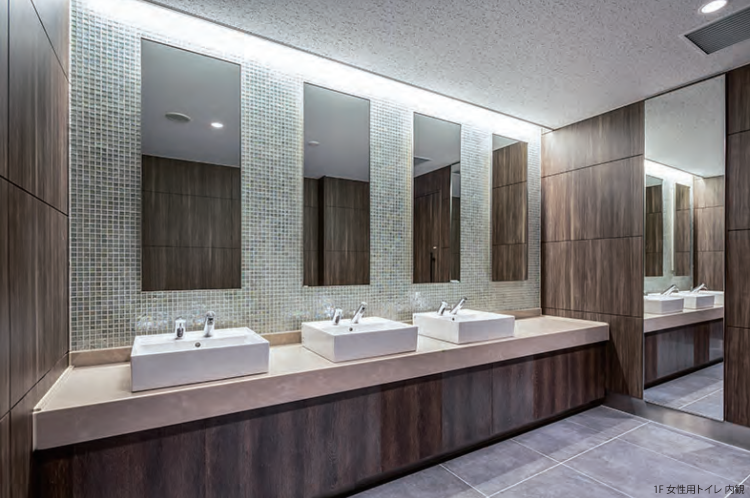
1F 女性用トイレ 内観