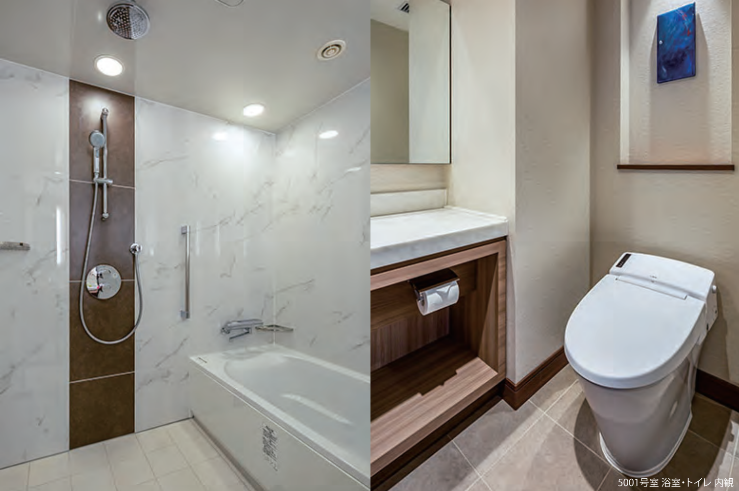
5001号室 浴室・トイレ 内観