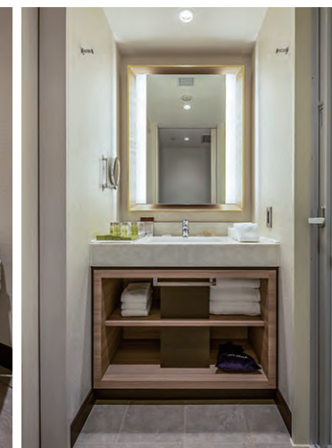
洗面 ※アドヴァン製