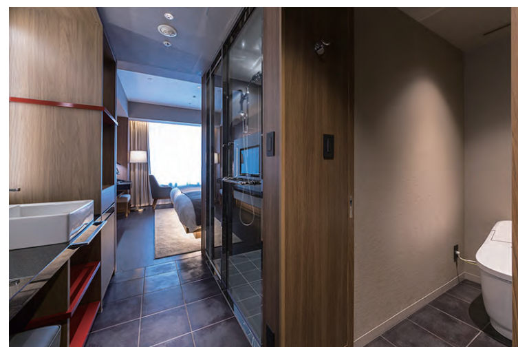
入り口から客室への内観