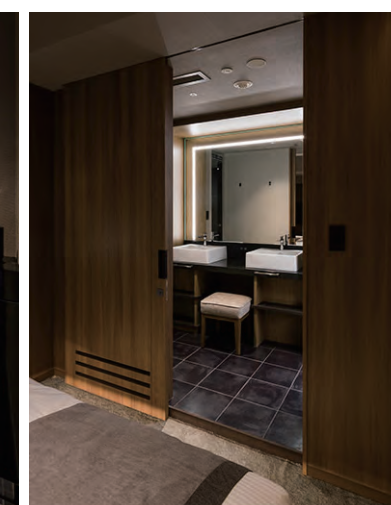
寝室から見た水まわり入り口