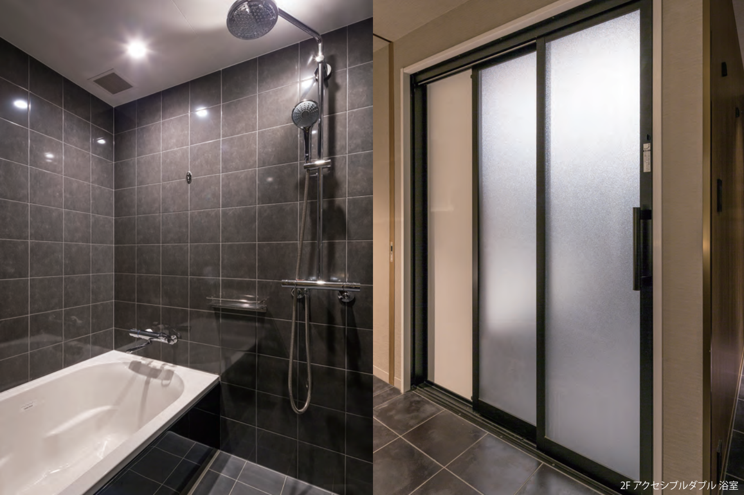
2F アクセシブルダブル浴室