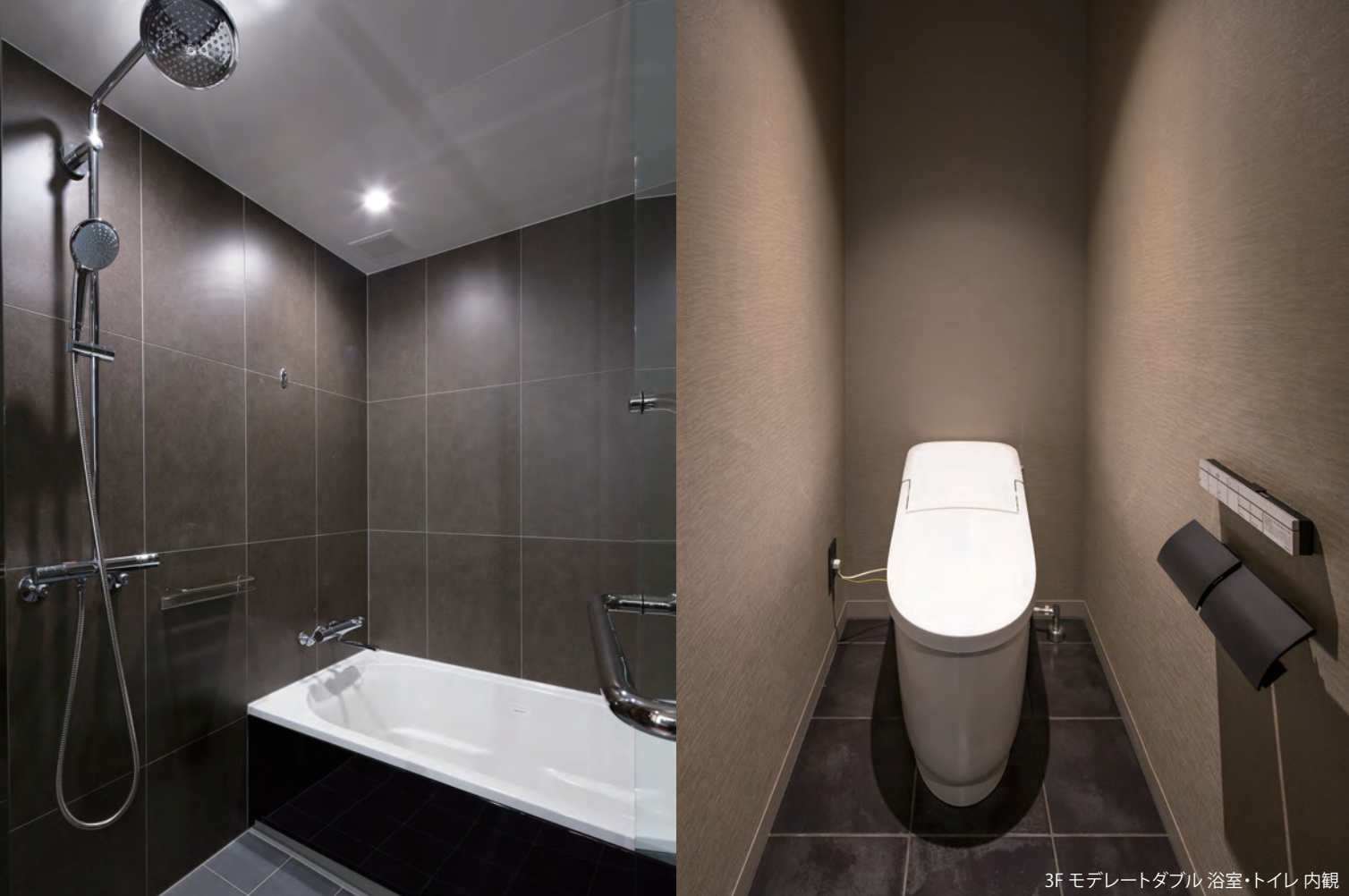
3F モデレートダブル 浴室・トイレ 内観