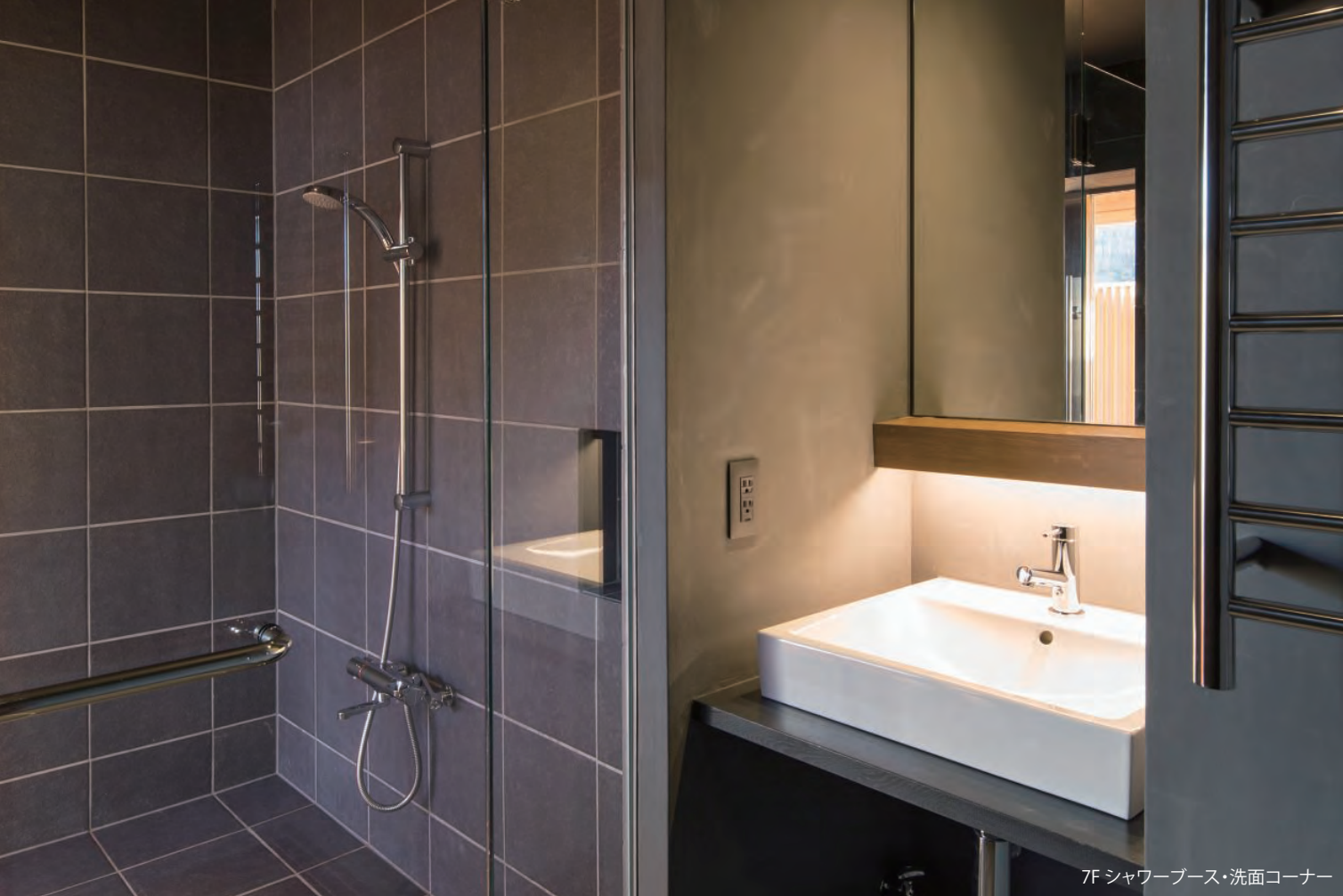
7F シャワーブース・洗面コーナー