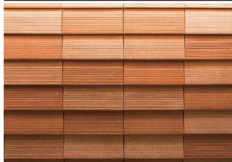
カウンター下部タイルディテール