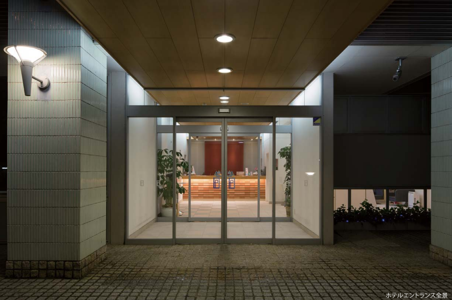
ホテルエントランス全景