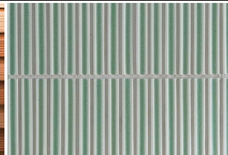
外壁タイルディテール