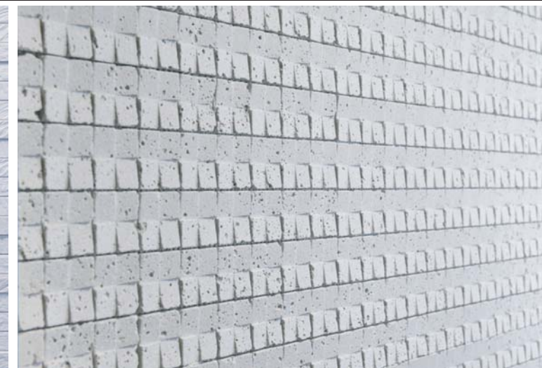
カウンターバックタイルディテール