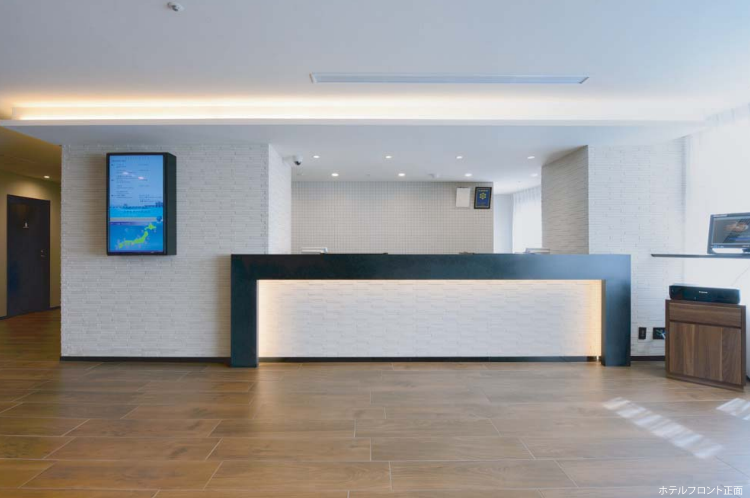
ホテルフロント正面