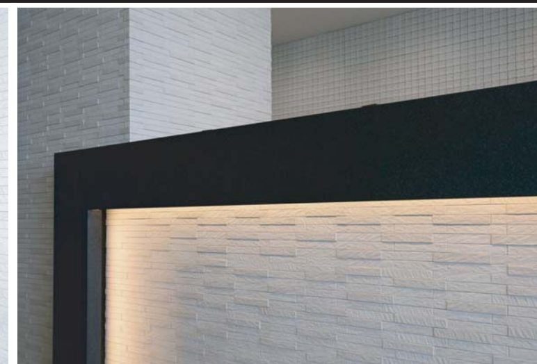
フロントカウンター・カウンターバック