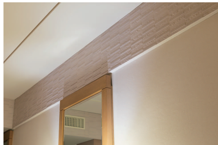
壁面上部タイルディテール