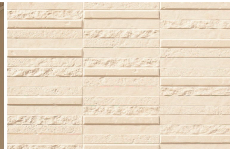
タイルディテール