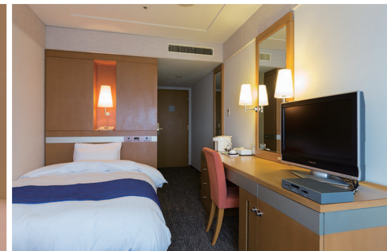
自然光下での客室