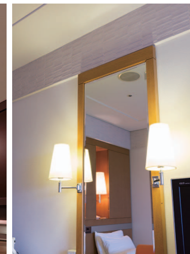
ブラケット照明上部