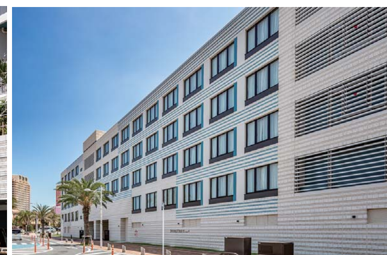
シティ側外観全景