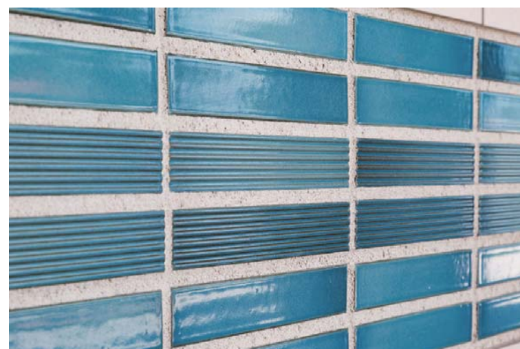
外装壁面ディテール