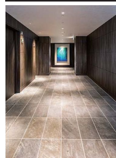
共用通路内装床面