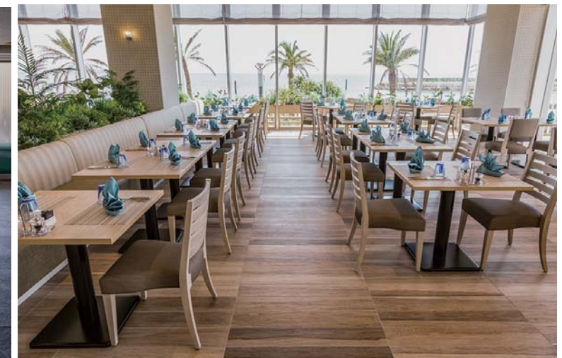
レストラン内装床面