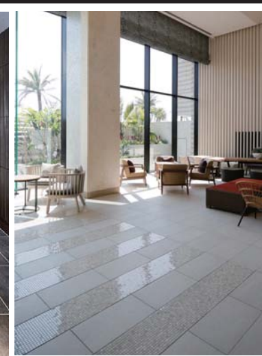
ラウンジ内装床面