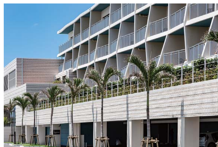
バルコニー外装壁面