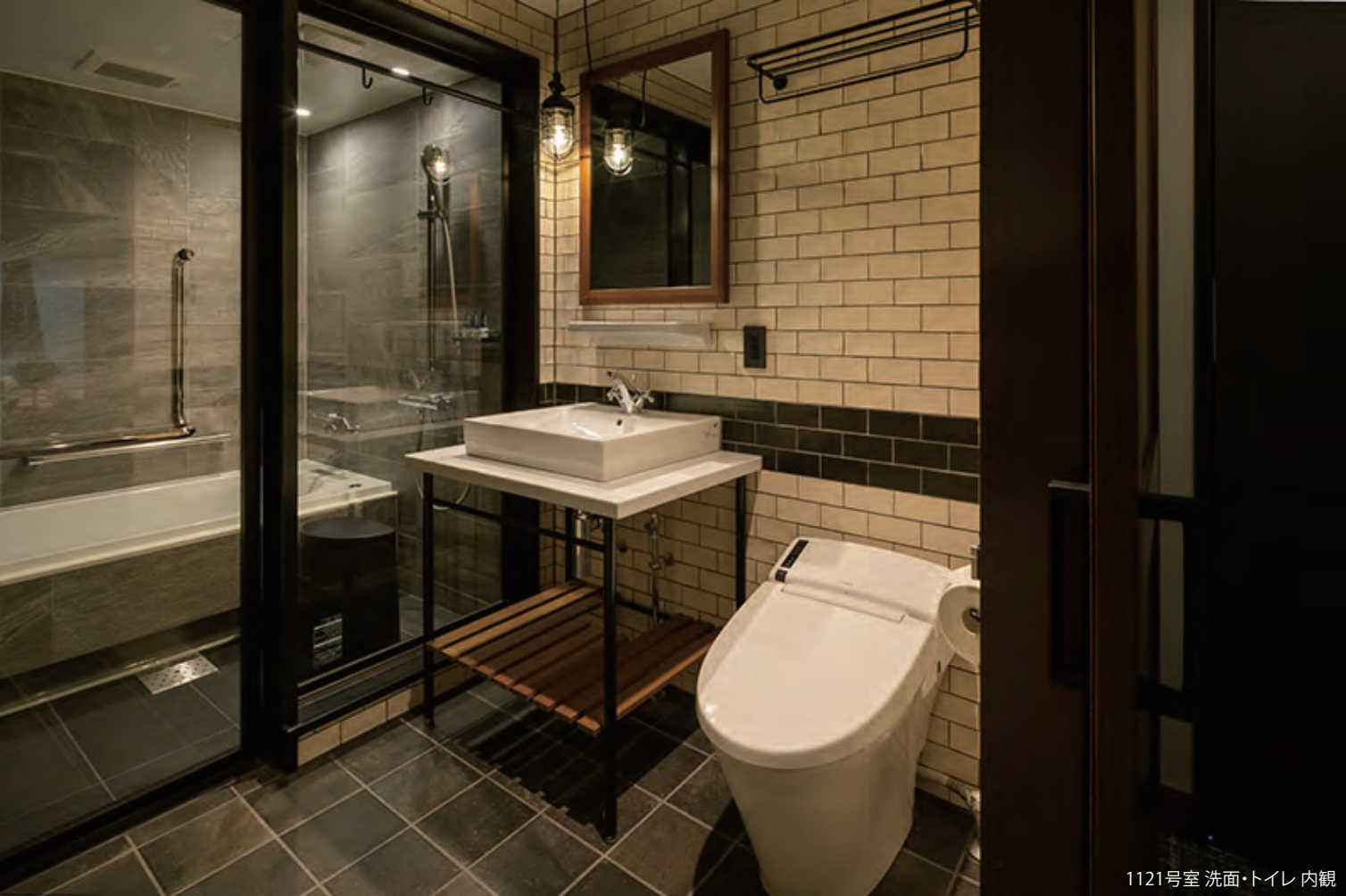
1121号室 洗面・トイレ 内観