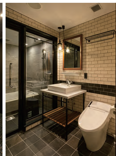
洗面・トイレ 内観