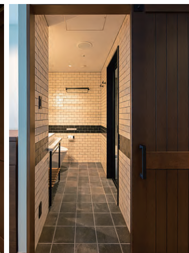
洗面・トイレ 内観