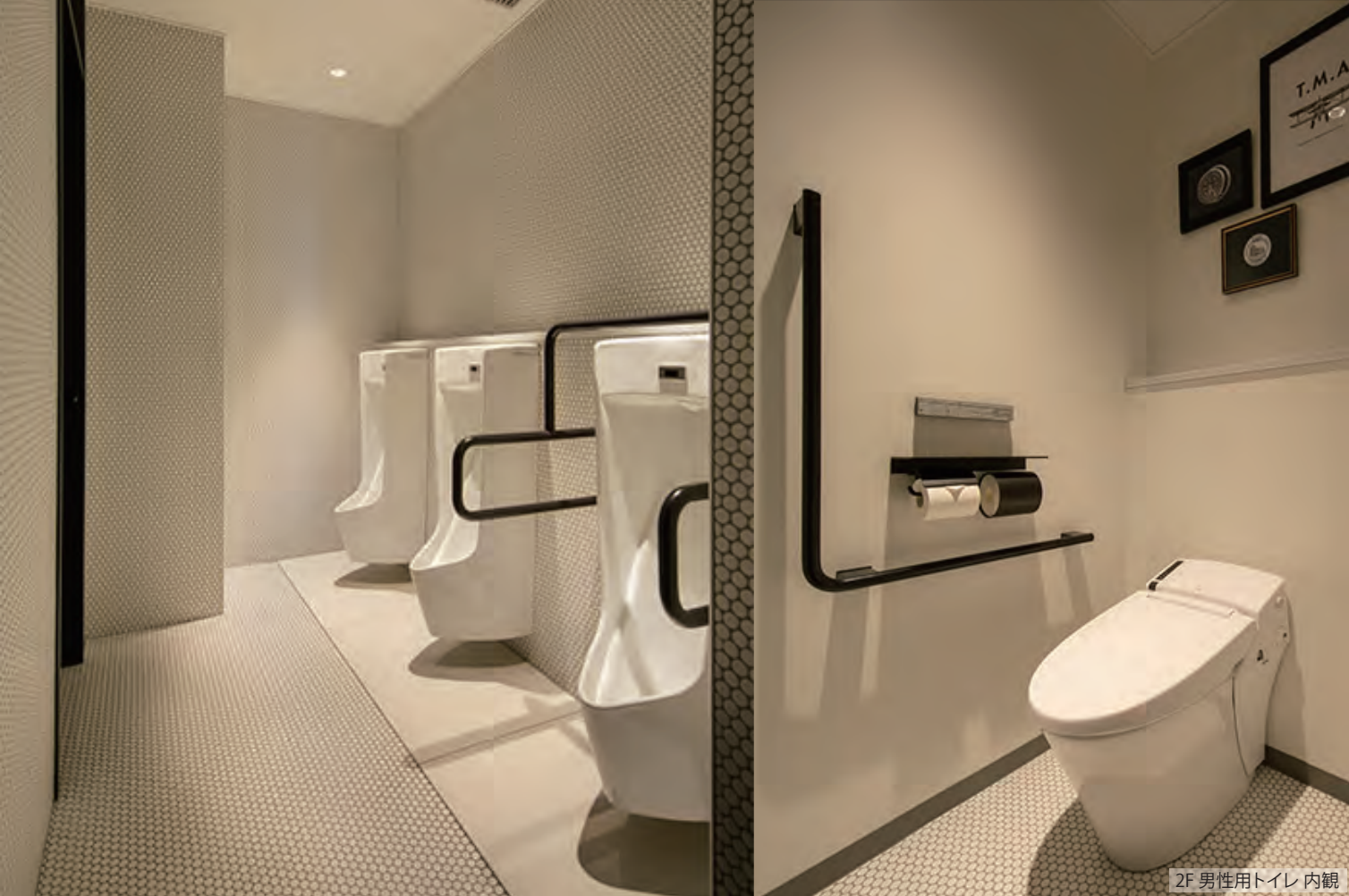
2F 男性用トイレ 内観