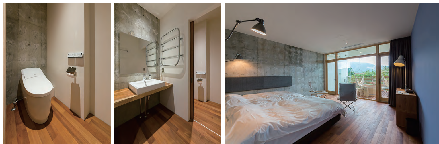
ゆとりある空間を演出するコンパクトなトイレとスタイリッシュな角形洗面器を設置。客室