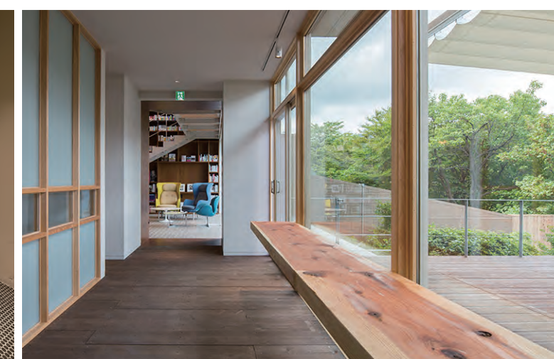
レストラン前通路