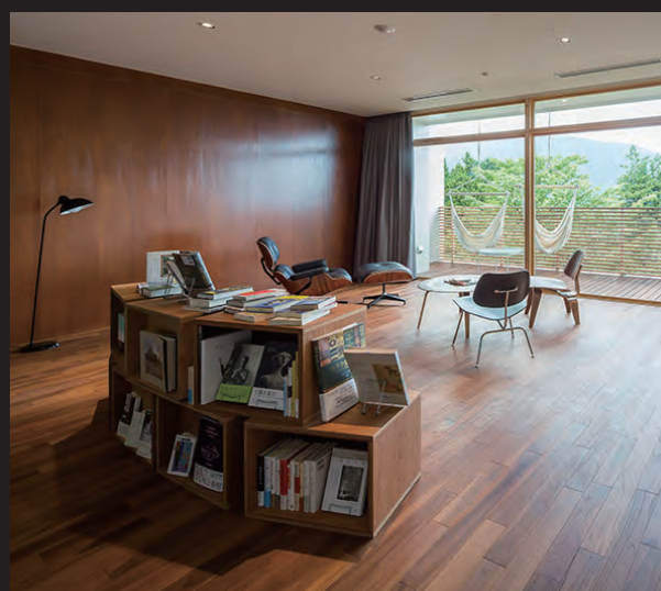
201号室 マウンテンビューコーナースイート 客室

<201号室> 大便器：YBC-G20S・DV-G218-R2 シャワー水栓：シャワー水栓【GROHE】 洗面器+水栓金具：L-536FC+LF-E340SYC <館内> 大便器：YBC-CL10S・DT-CL114A