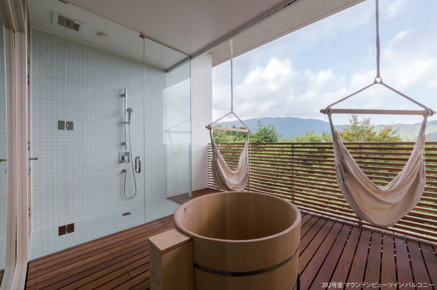
202号室 マウンテンビューツイン バルコニー