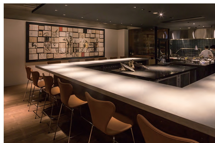
オープンキッチンカウンター