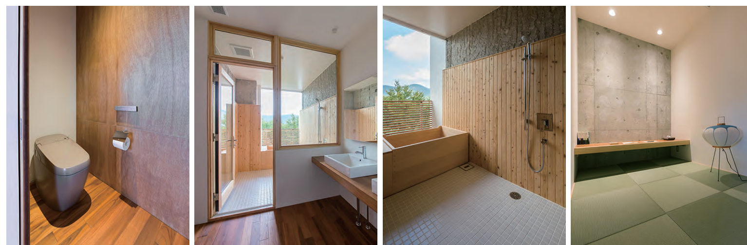
トイレは温かみを帯びた色味のサティスノーブルレーベルを採用。浴室にはシャープなデザインの埋め込み水栓を備えている。 客室