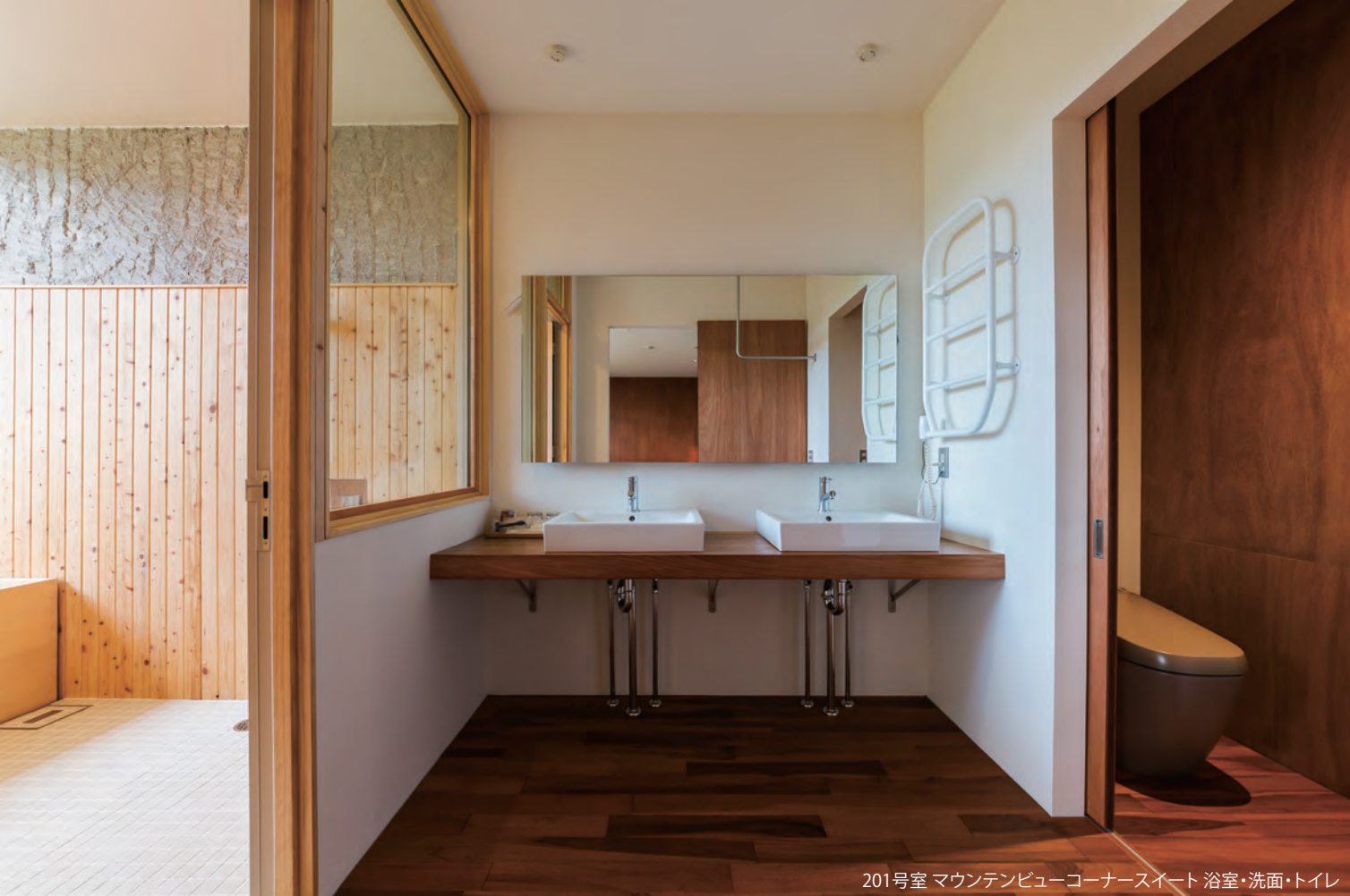
201号室 マウンテンビューコーナースイート 浴室・洗面・トイレ