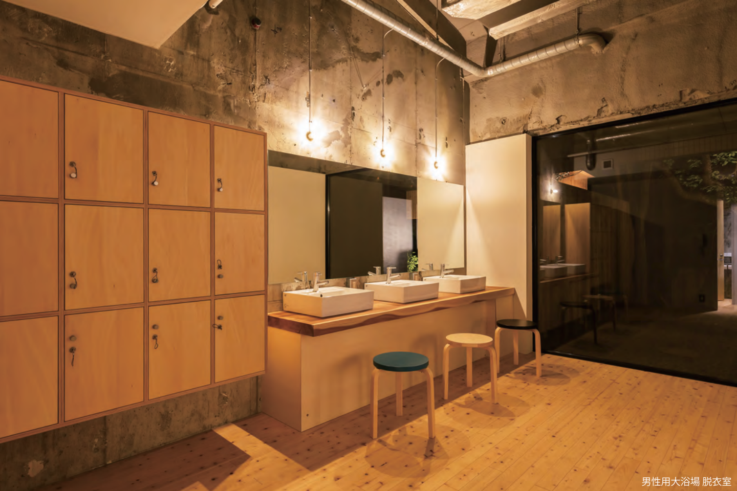
男性用大浴場 脱衣室