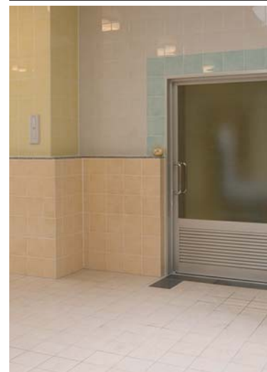
浴室内装壁・床タイル