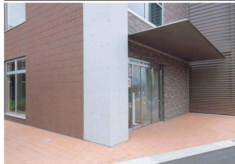
サブエントランス外観