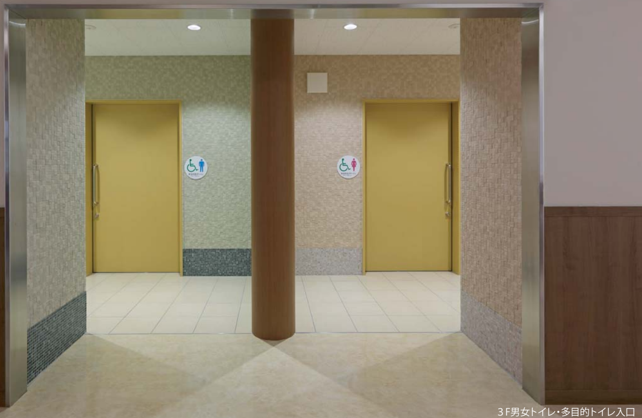
3F男女トイレ・多目的トイレ入口