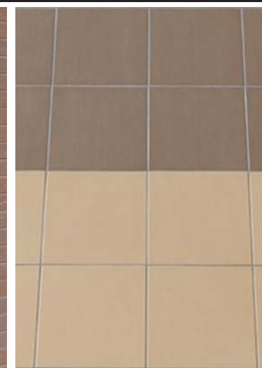
エントランス床面タイルディテール