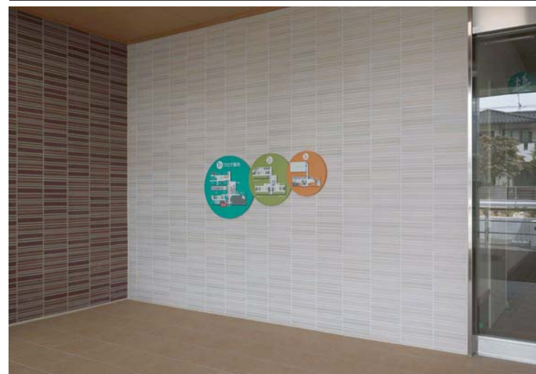
サブエントランス(時間外入口側)壁床面タイル