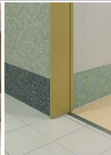
3階男子/多目的トイレ壁・床ディテール