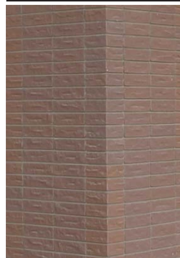
エントランスホール支柱タイルディテール