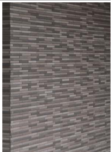
サブエントランスタイルディテール