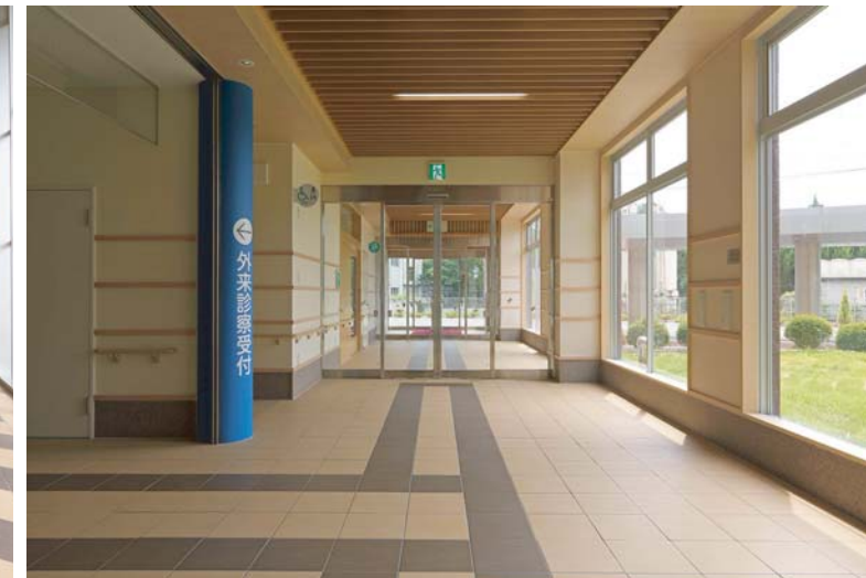
サブエントランス