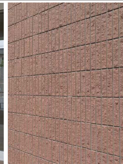
外装壁タイルディテール