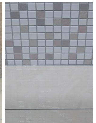
1階男女トイレ壁・床タイルディテール