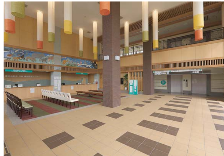
エントランスホール/ロビー