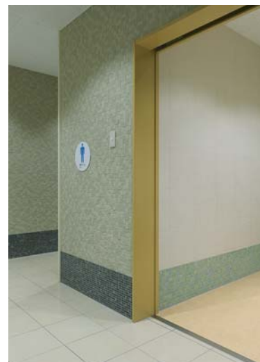
3階男子トイレ入口・多目的トイレ