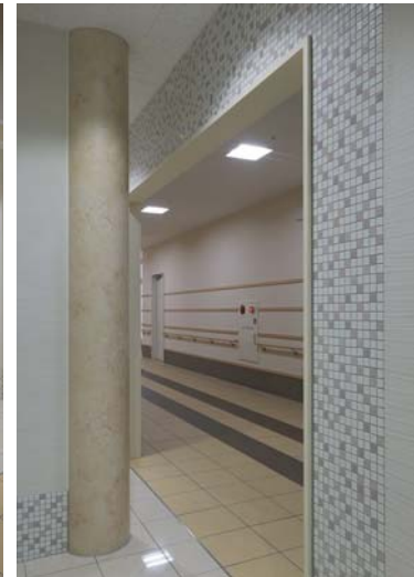
1階男女トイレ入口(内側)