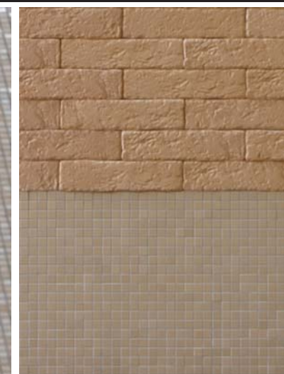
デイルーム壁装面タイルディテール