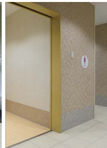
3階女子トイレ入口・多目的トイレ