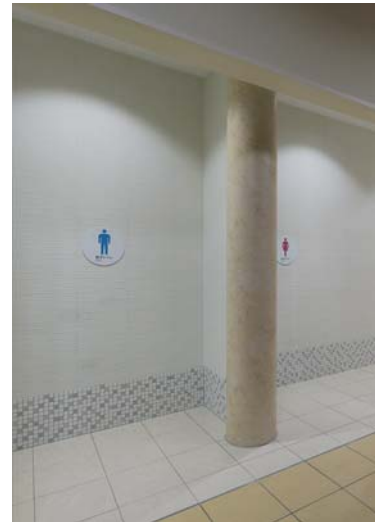
1階男女トイレ入口