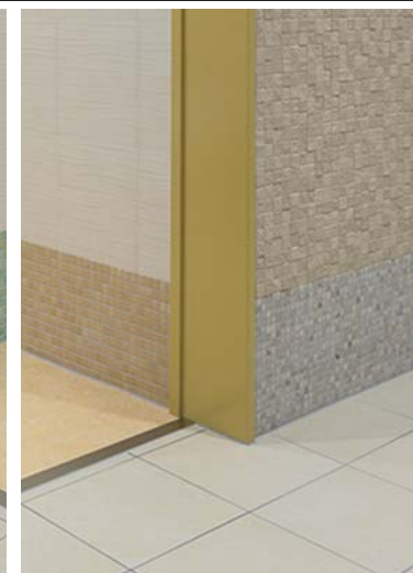
3階女子/多目的トイレ壁・床ディテール