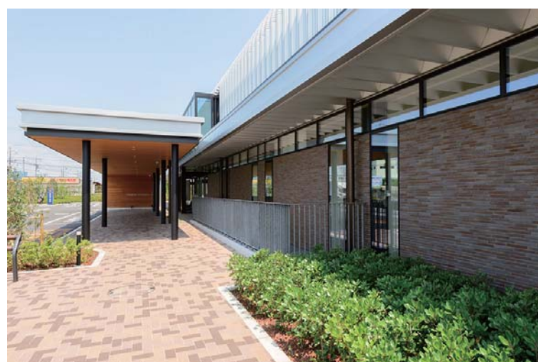
エントランス外装壁面