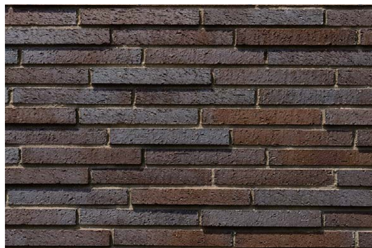
外装壁面タイルディテール