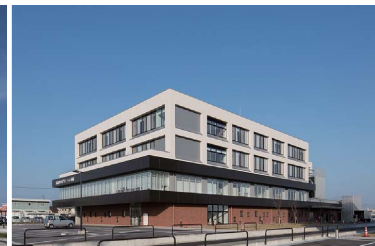
富山西リハビリテーション病院 全景