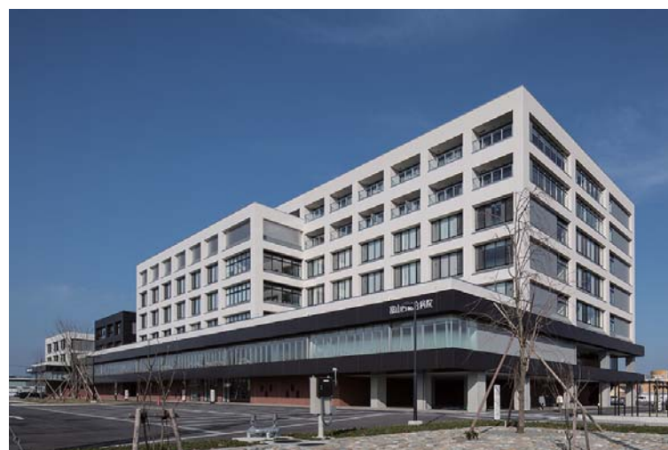
富山西総合病院 全景