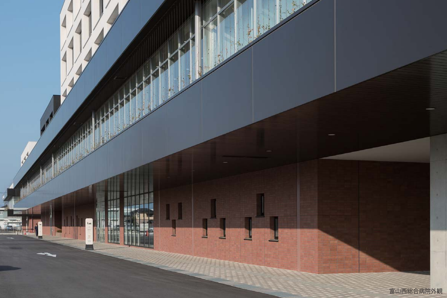
富山西総合病院外観