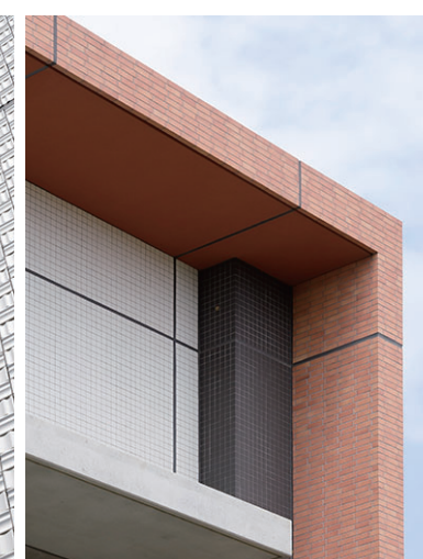
外装壁面(コーナー部)