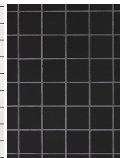
外装タイルディテール