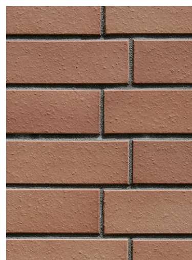
外装タイルディテール