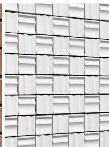
外装タイルディテール