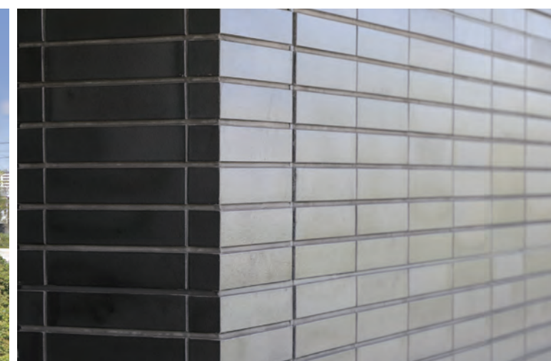
外装壁面(コーナー部)