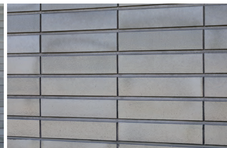
外装壁タイルディテール