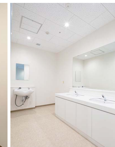
6F 洗面・洗髪コーナー

出入口脇の手洗い設備に、手首までしっかり洗える医療スタッフ用洗面器を採用。洗面室には洗髪器も導入されている。