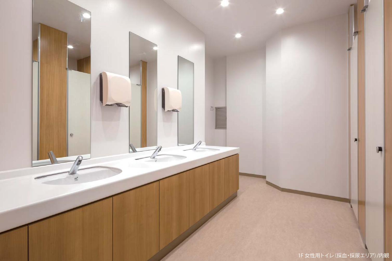
1F 女性用トイレ (採血・採尿エリア) / 内観