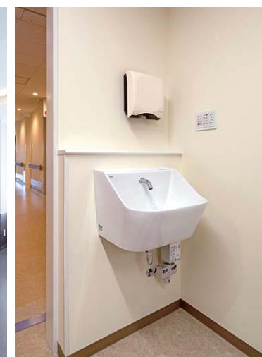
6F スタッフコーナー

出入口脇の手洗い設備に、手首までしっかり洗える医療スタッフ用洗面器を採用。洗面室には洗髪器も導入されている。