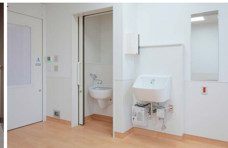
4F HCU 感染症病床

室内には手首までしっかり洗える大型手洗器を設置。深い鉢を利用しているため、鉢底面や側面に指先が当たりにくく衛生的に使用できる。