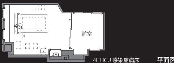
4F HCU 感染症病床 平面図

掲載内容及び写真・図版の無断転載はかたくお断りします。(許可なく転載・流用した場合、損害賠償が発生します。)