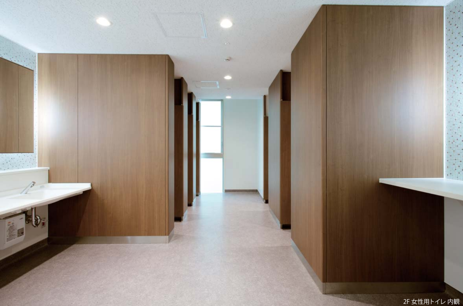
2F 女性用トイレ 内観