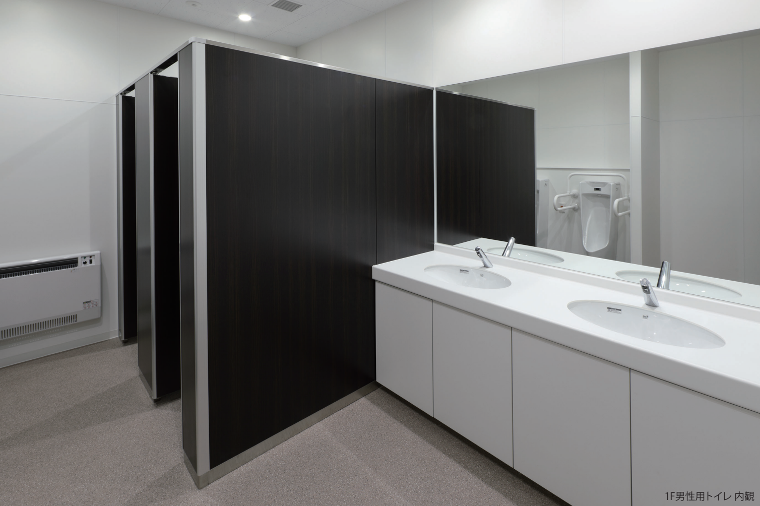
1F男性用トイレ 内観