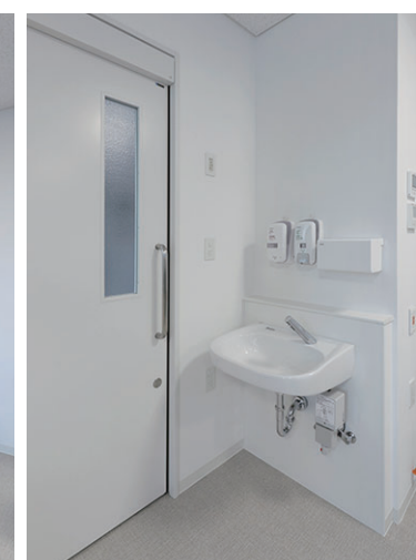
3F スタッフステーション

食事や面会などに利用できる入院患者の共用スペース。窓からの自然光が差し込む明るい室内にはテーブル席とカウンター席を設け、シンクも設置。また、出入口には洗面器を設置し、利用者の衛生面に配慮している。