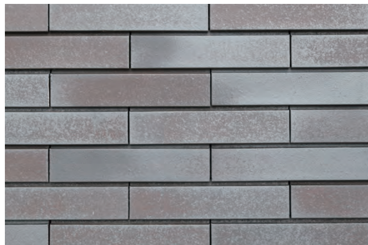
外装壁面タイルディテール