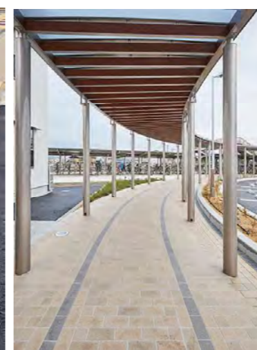
JR三本松駅からのシェルター