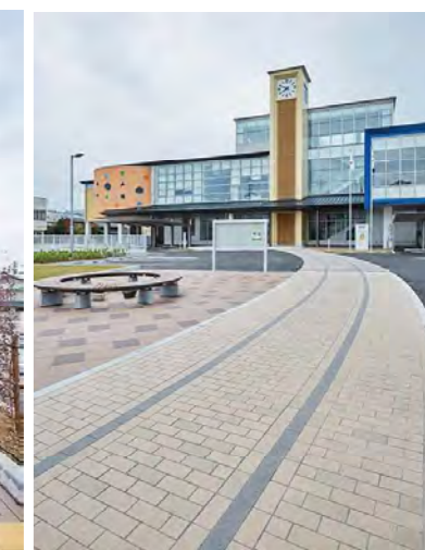
広場からのアクセス