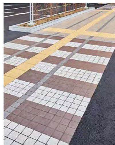
南側入り口へのアクセス