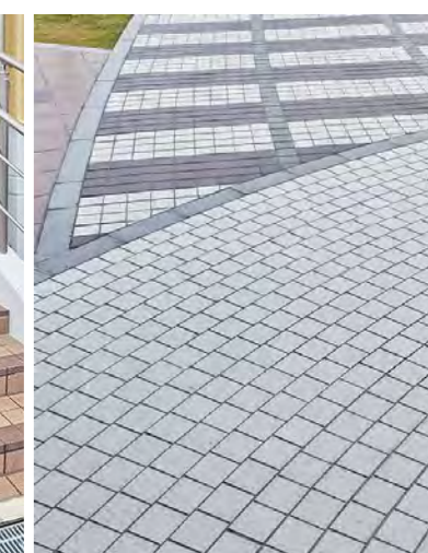
舗装面の交差部分