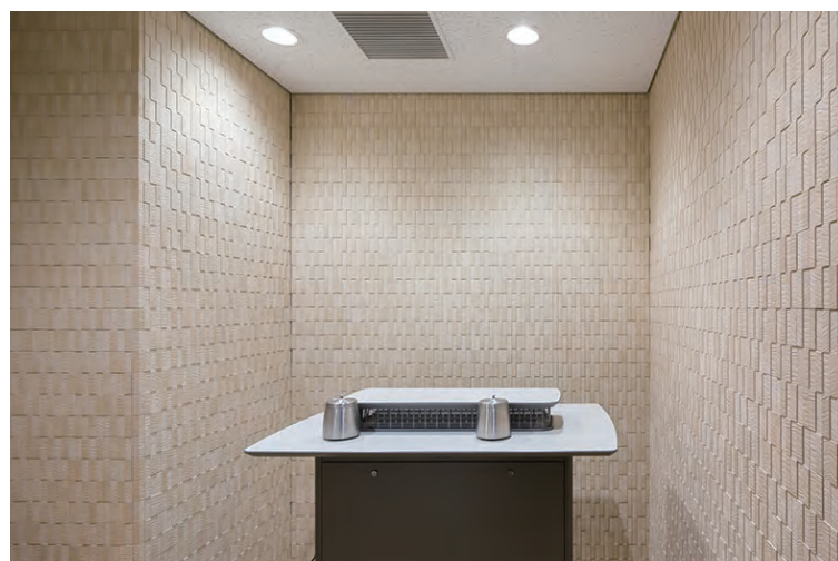
喫煙室内装機能建材壁面エコカラットプラス