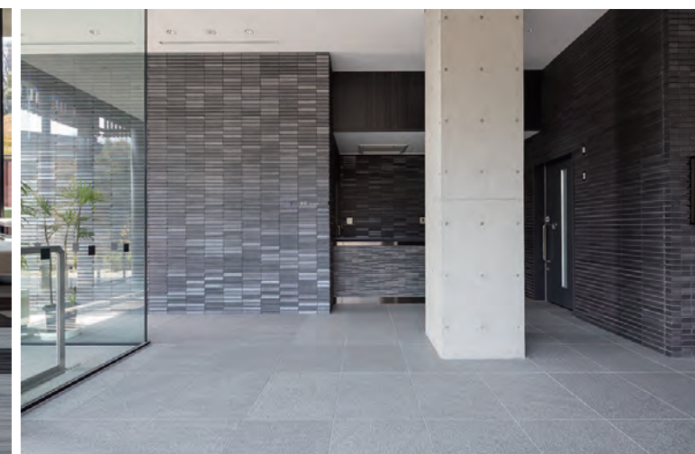
エントランス内装壁面