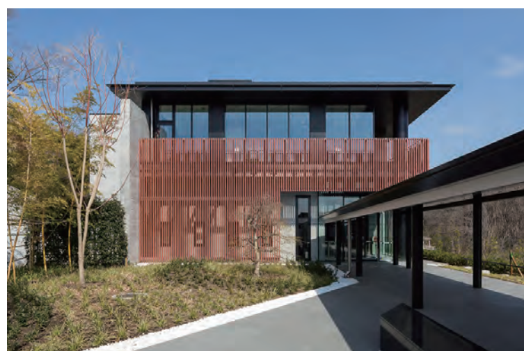
エントランス入口外装壁面