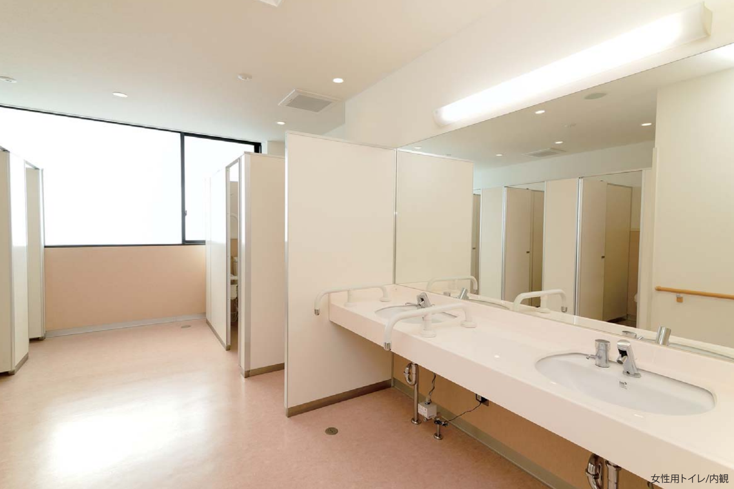
女性用トイレ/内観