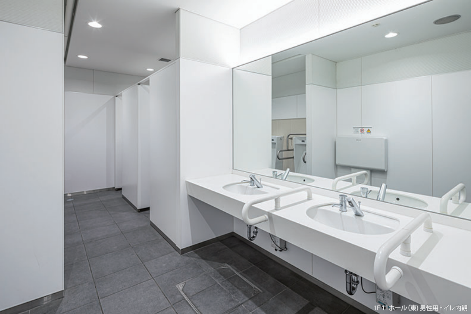
1F 11ホール(東) 男性用トイレ内観