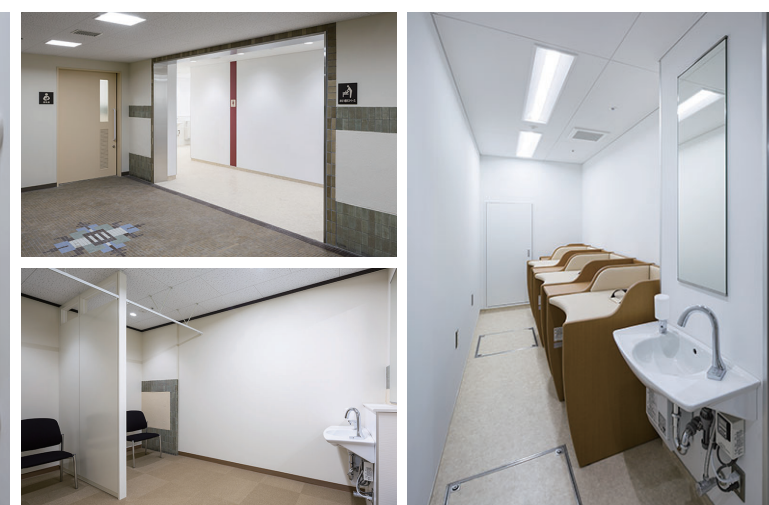
B1F トイレ入り口まわり・授乳室・おむつ替えスペース

授乳室とおむつ替えスペースには作業の前後に手が洗えるよう洗面器を設置し、利用者の衛生面に配慮している。