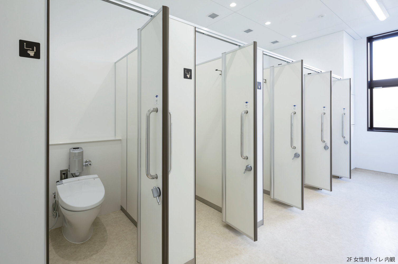
2F 女性用トイレ 内観