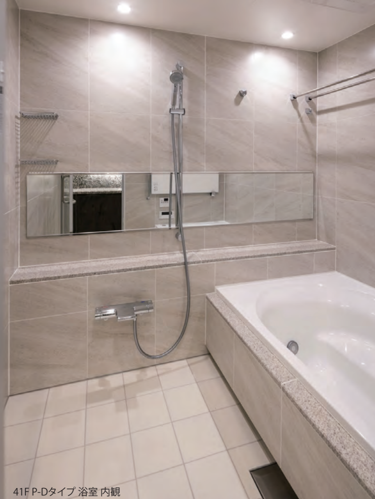
41F P-Dタイプ 浴室 内観