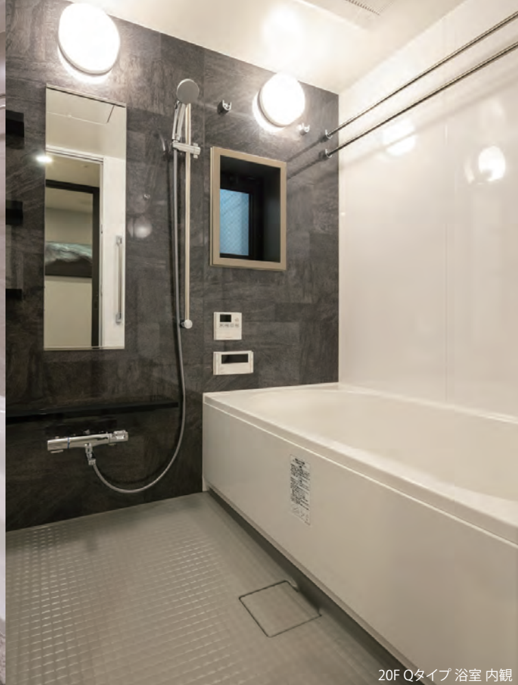
20F Qタイプ 浴室 内観