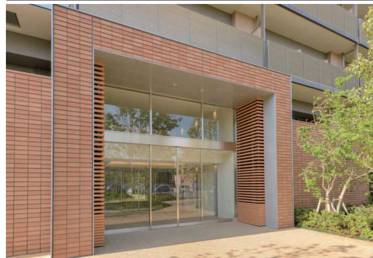
エントランス外装壁