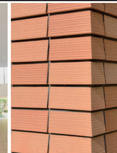
エントランスまわりタイルディテール