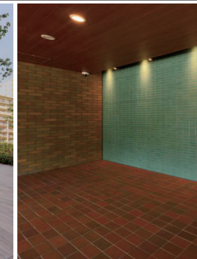
コーチエントランス内装壁床