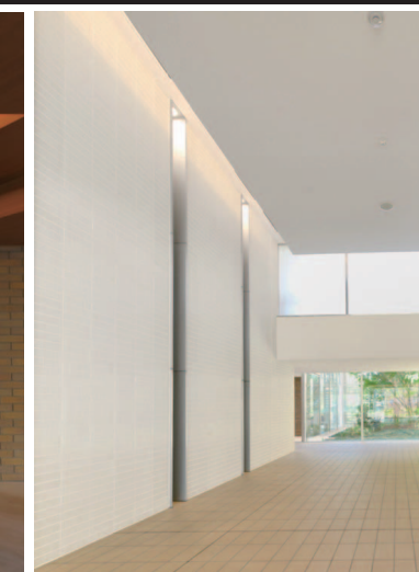
グランドエントランスホール内装壁床