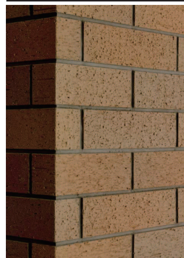
ガーデンラウンジ内装壁タイルディテール