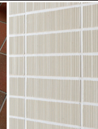
グランドエントランスホール内装壁タイルディテール