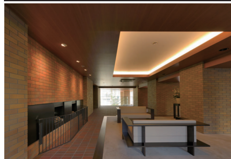
ガーデンラウンジ