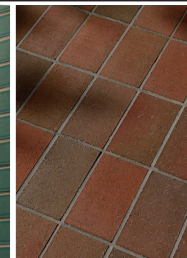
ガーデンラウンジ内装床タイルディテール