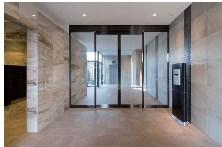
エントランス内装壁床面