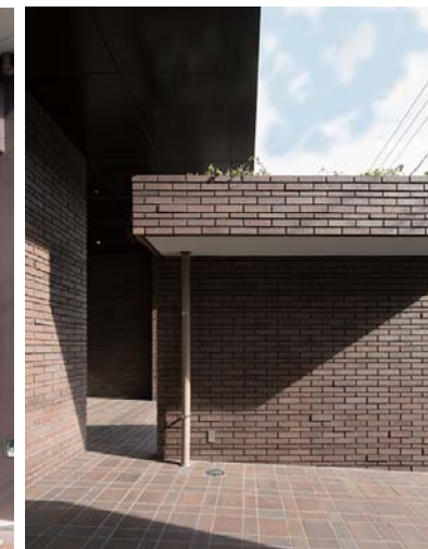
エントランス外装壁床面