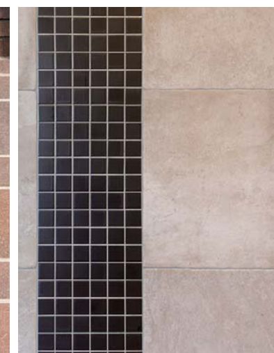
外装壁面タイルディテール