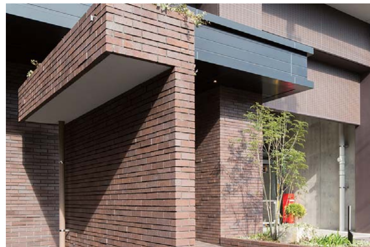
エントランス外装壁面