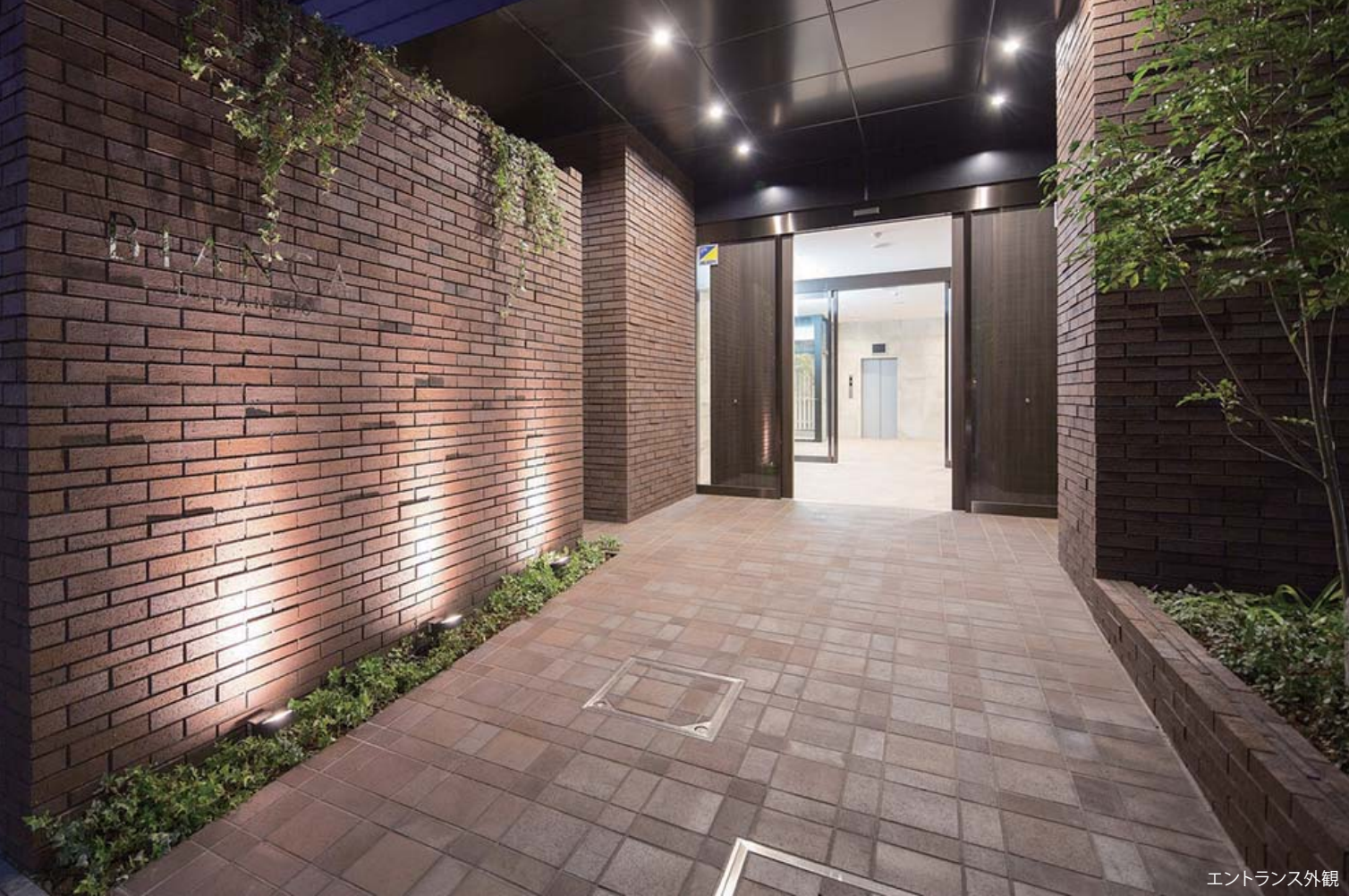
エントランス外観