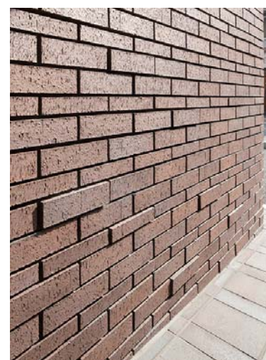
外装壁面タイルディテール