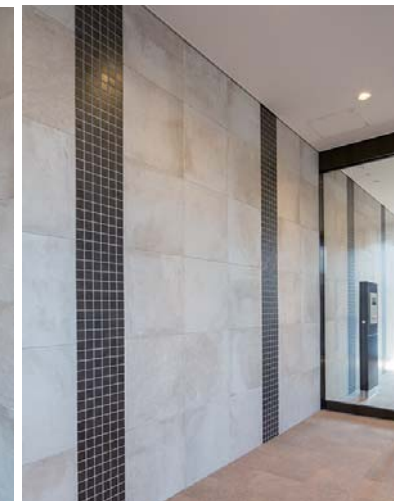
エントランス内装壁面