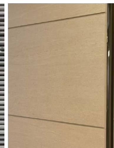
内装壁面タイルディテール