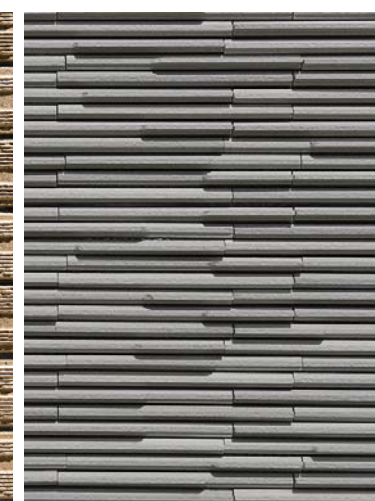
外装壁面タイルディテール