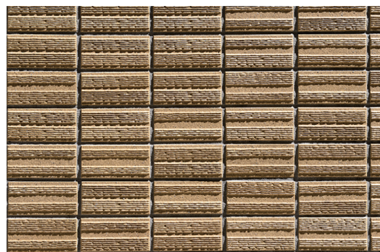
外装壁面タイルディテール