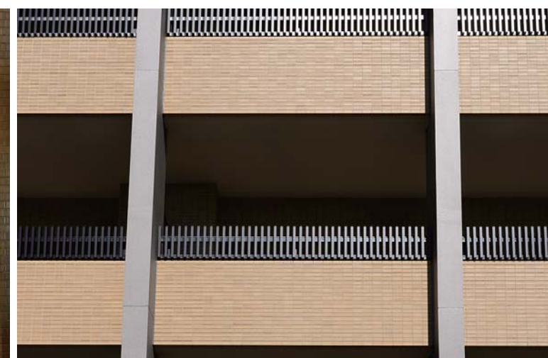
ベランダ外装壁面