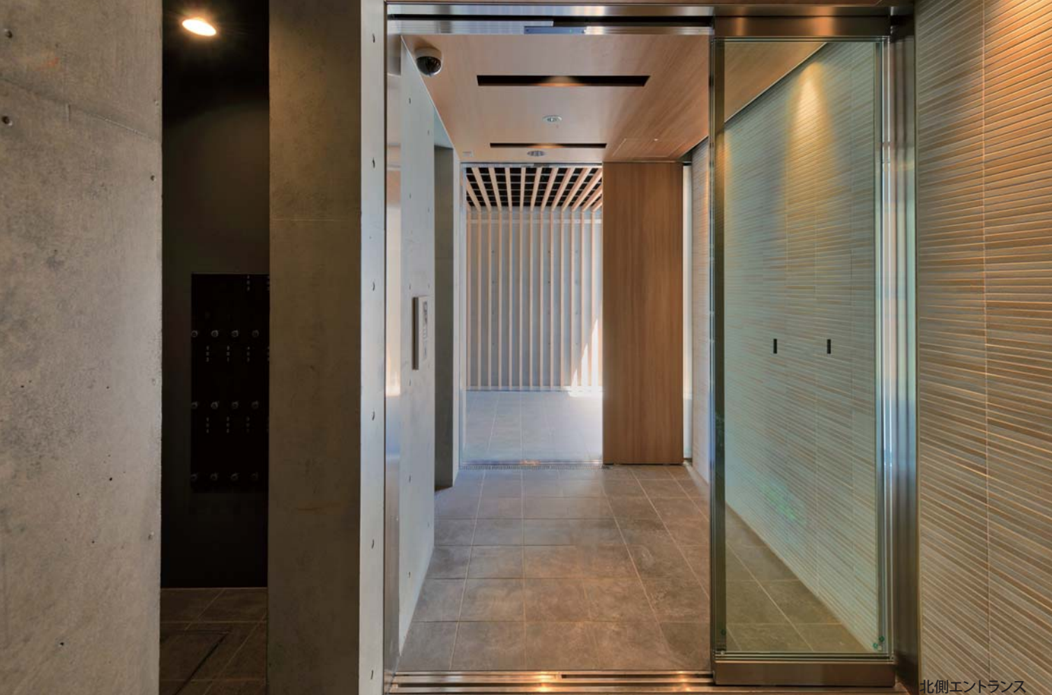
北側エントランス