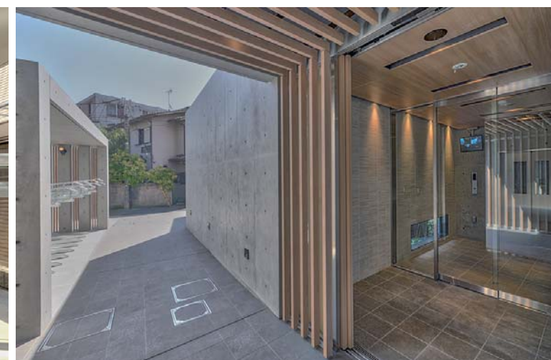
東側外観とエントランス