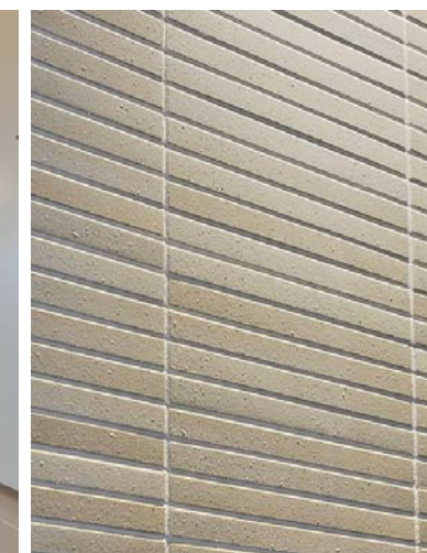
内装壁面タイルディテール