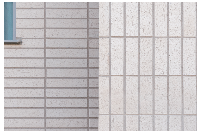
外装壁面タイルディテール