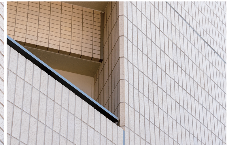
ベランダコーナー部詳細