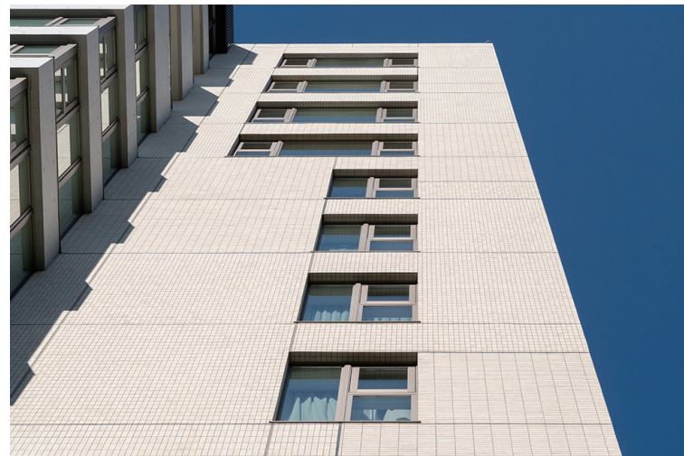
外壁見上げ(タイル張分け)