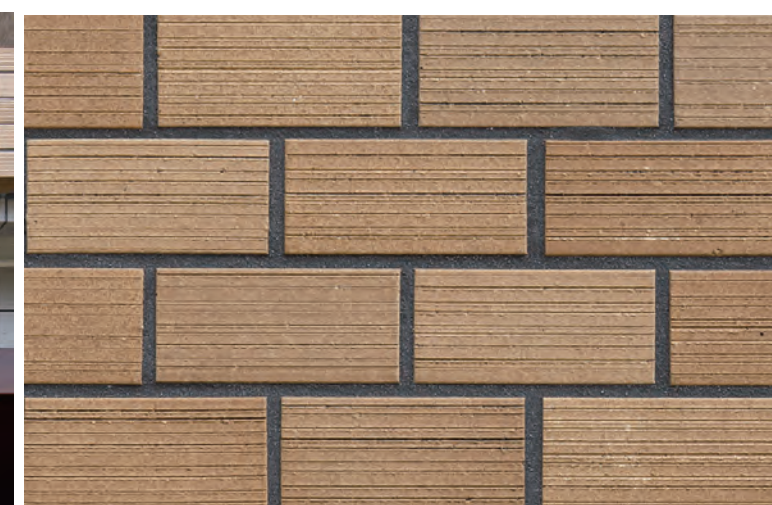
外装壁面タイルディテール