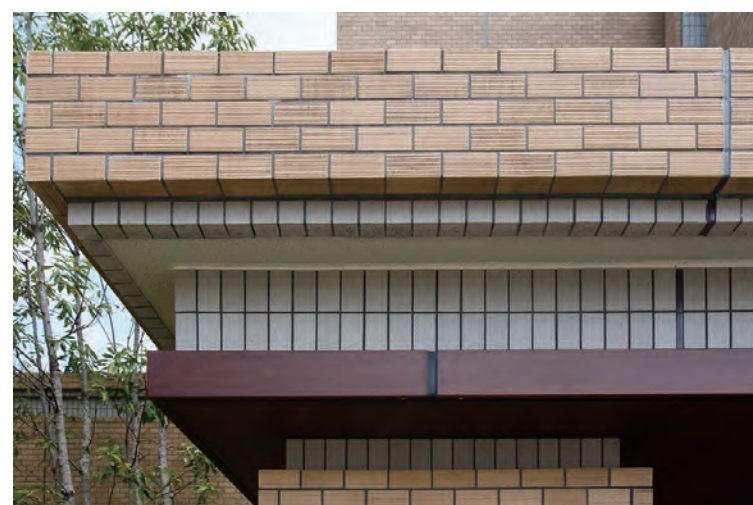
大庇タイルディテール