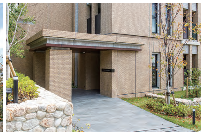
エントランス入口部