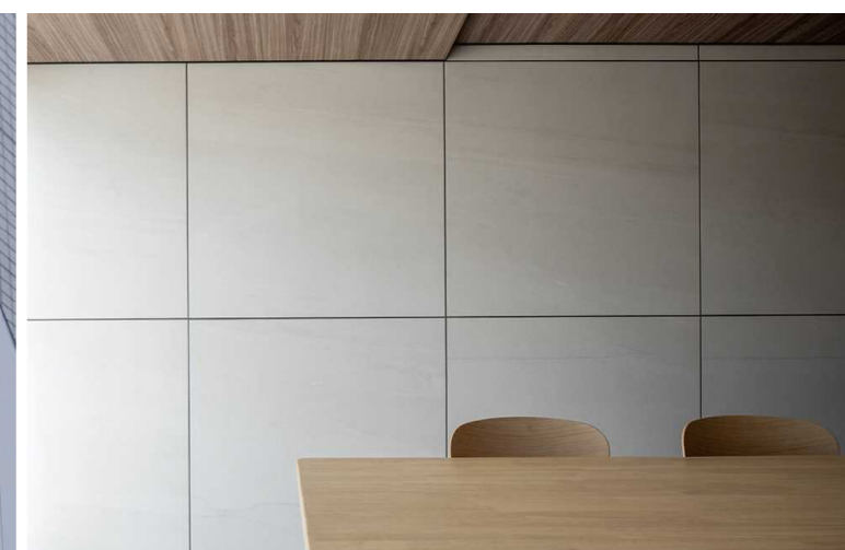
内装壁面タイルディテール