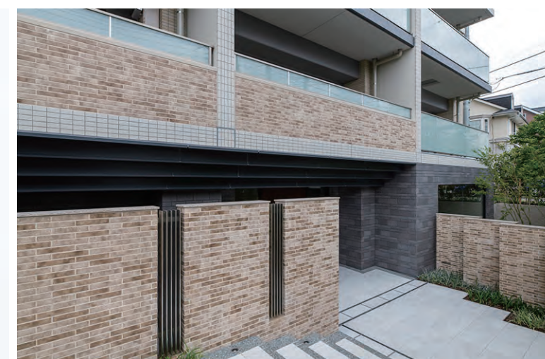
南西側外装壁面、アプローチ