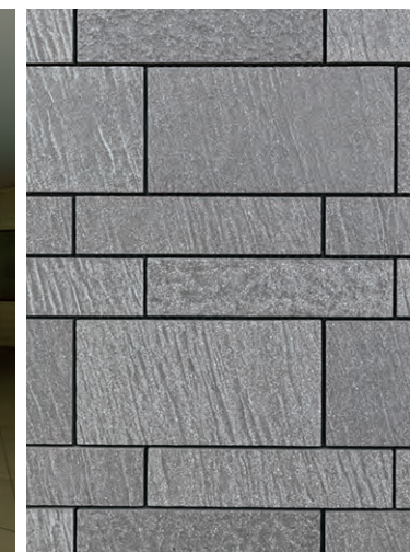
内外装壁タイルディテール