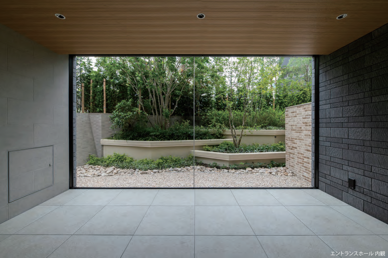
エントランスホール内観