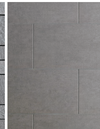
内装壁タイルディテール