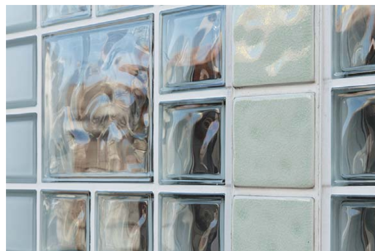
外装壁面タイルディテール