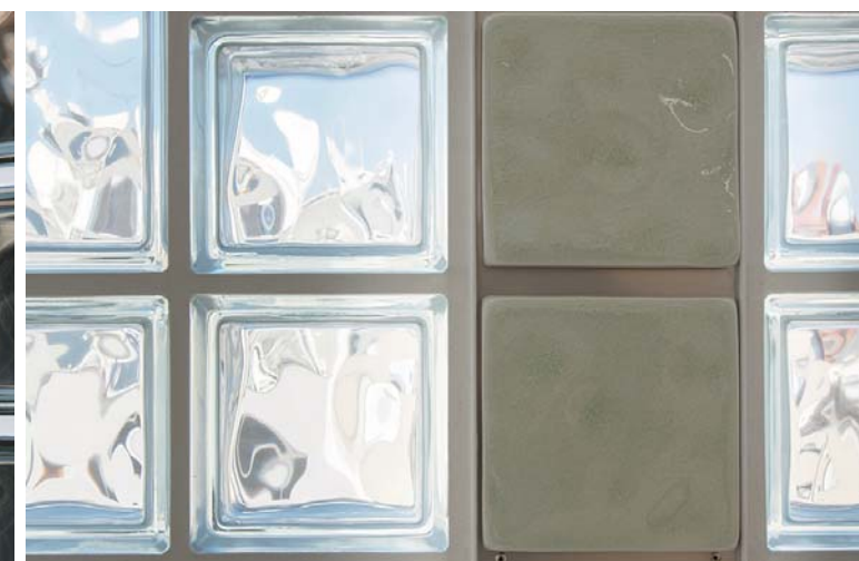
内装壁面タイルディテール