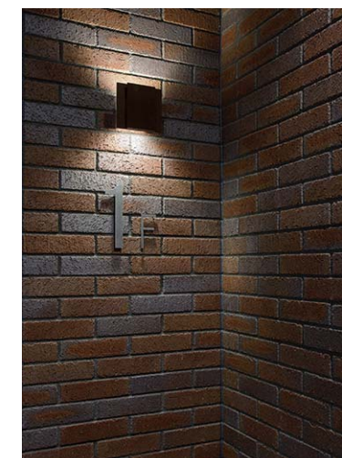
エレベーターホール壁