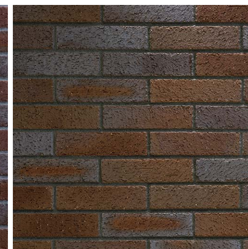
エレベーターホール壁