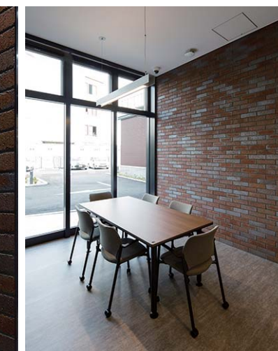
打ち合せコーナー