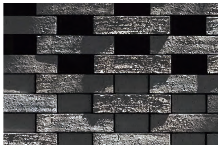
室内壁テラコッタブロックテクスチャ