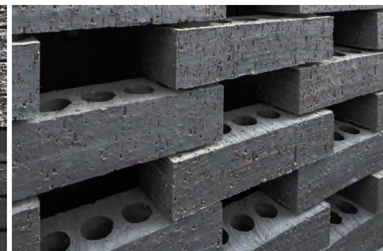
室内壁テラコッタブロックテクスチャ