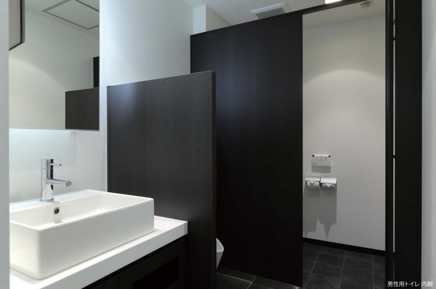
男性用トイレ 内観