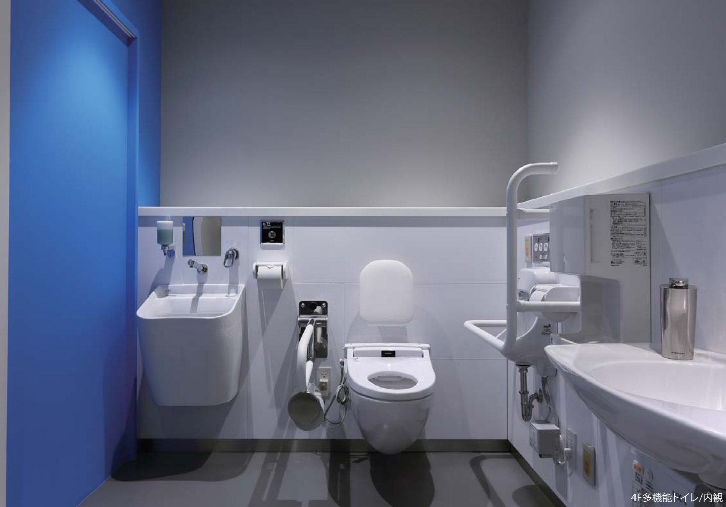
4F多機能トイレ/内観