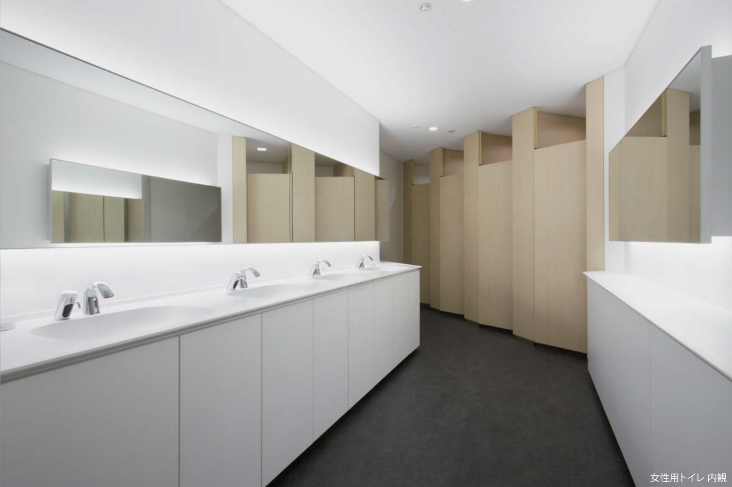
女性用トイレ 内観